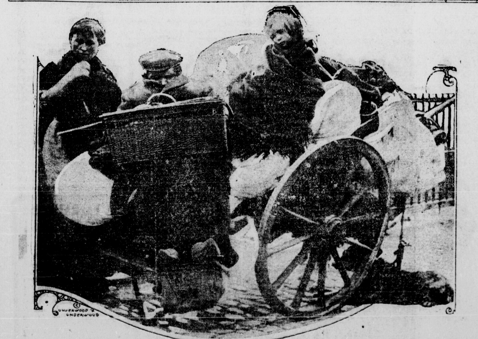
Une famille de réfugiés belges surie route vers la Hollande. Ils ont placés leurs effets les plus précieux sur une charette et se sont en-fuis devant les Allemands.