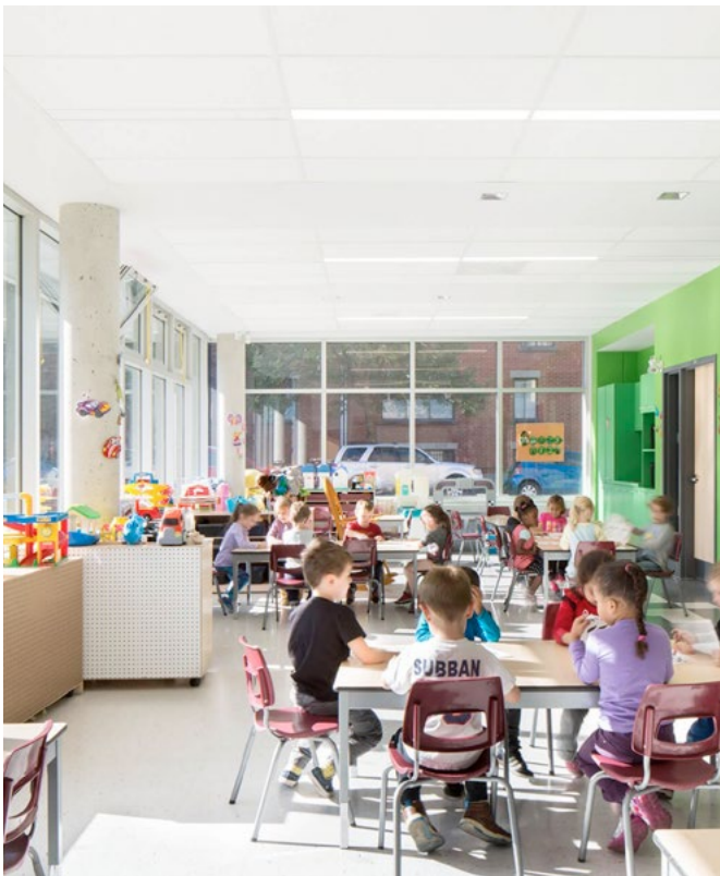
École primaire Baril, 2017 Commission scolaire de Montréal BBBL - groupe Provencher_Roy