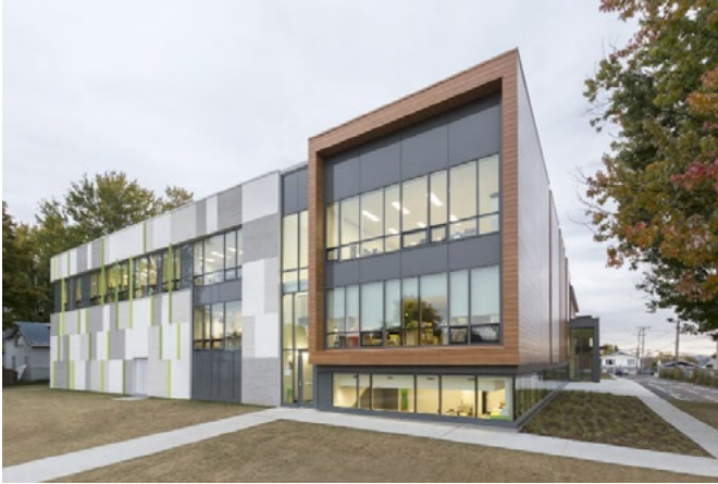
École primaire Beau Séjour | Agrandissement 2015 Commission scolaire de la Capitale CCM2 architectes