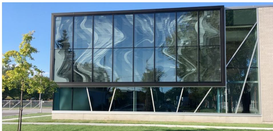
Mur thermique de l'école Notre Dame, 2017 | Commission scolaire Des Samares Blouin Leclerc architecte | GBI services d'ingénierie

Dans ce contexte, les choix architecturaux doivent tenir compte de la pérennité de l'école et d'une durée de vie du bâtiment de 75 ans. Cela implique la notion de qualité, qui fait référence tant à l'intégrité du projet qu'à l'intégrité du processus et au caractère durable du bâtiment.