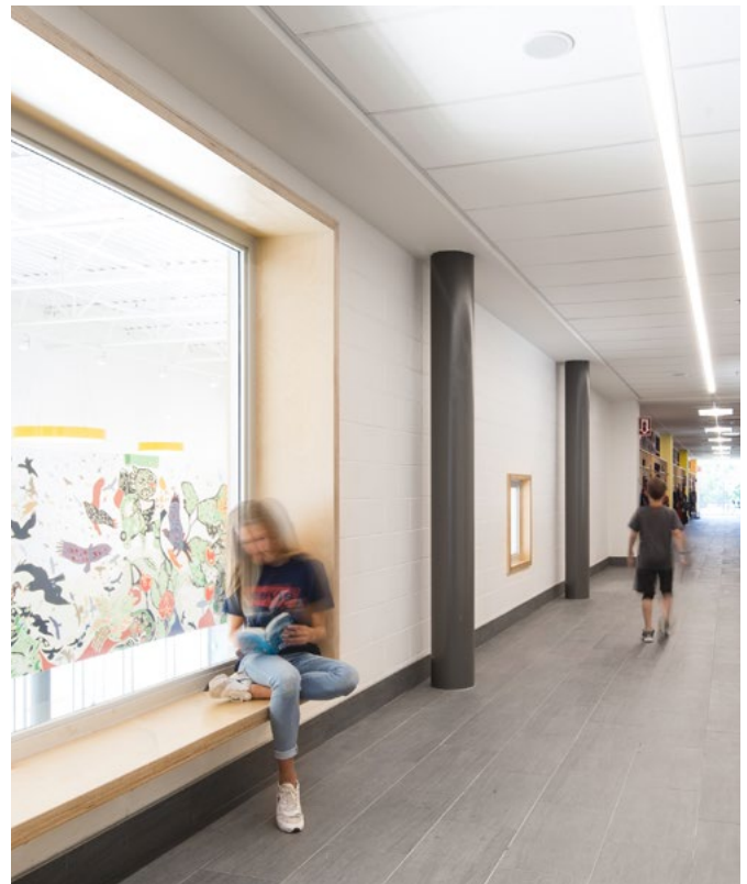
École des Jardins-des-Patriotes, 2017 Commission scolaire de la Seigneurie-des-Mille-Îles BBBL - groupe Provencher_Roy et YWA