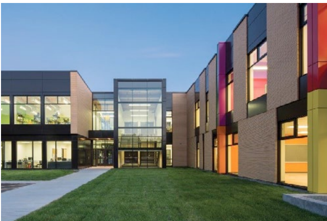
École Sans-Frontières, 2014 Commission scolaire de la Rivière-du-Nord BBBL architectes et Bergeron-Thouin Associés Architectes