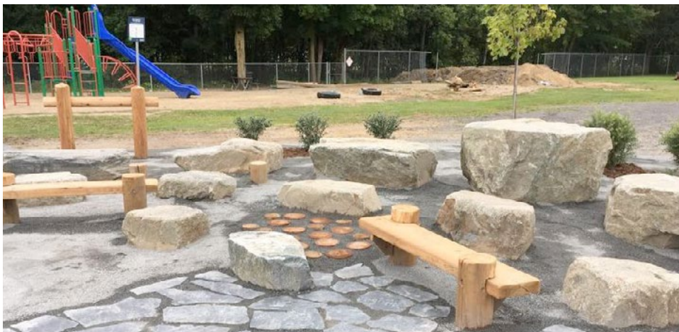
École Saint-Étienne | Commission scolaire des Chênes