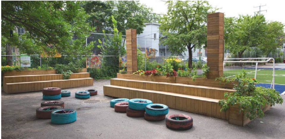
École Saint-Fidèle | Commission scolaire de la Capitale