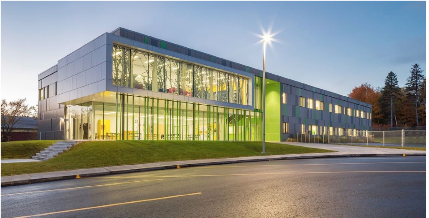
École primaire Boréal, 2014 | Commission scolaire des Premières-Seigneuries