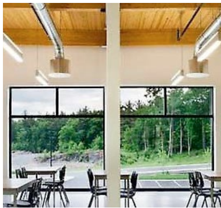
École primaire Sans-Frontières, 2014 Commission scolaire de la Rivière-du-Nord BBBL architectes et Bergeron-Thouin Associés Architectes

Plusieurs études 13 ont conclu que l'éclairage plein spectre ou spot LED (contenant des UV) avait de réels effets positifs sur le développement intellectuel et physique des élèves, leurs résultats scolaires, leur assiduité aux cours, leur santé et même leur croissance. Le ministère de l'Éducation de l'Alberta au Canada, en collaboration avec des spécialistes (médecins, éducateurs, travailleurs sociaux, diététiciens et dentistes), a constaté l'influence de la lumière plein spectre sur des enfants du primaire qui ont appris plus vite et obtenu de meilleurs résultats scolaires, et témoigne d'une diminution de 33 % des absences liées à la maladie. De plus, la lumière plein spectre a des effets bénéfiques sur les enfants hyperactifs. Selon une étude menée en Floride, plusieurs élèves hyperactifs ayant des problèmes d'apprentissage confirmés se sont calmés et ont surmonté leurs problèmes dans un environnement de lumière plein spectre 14 .