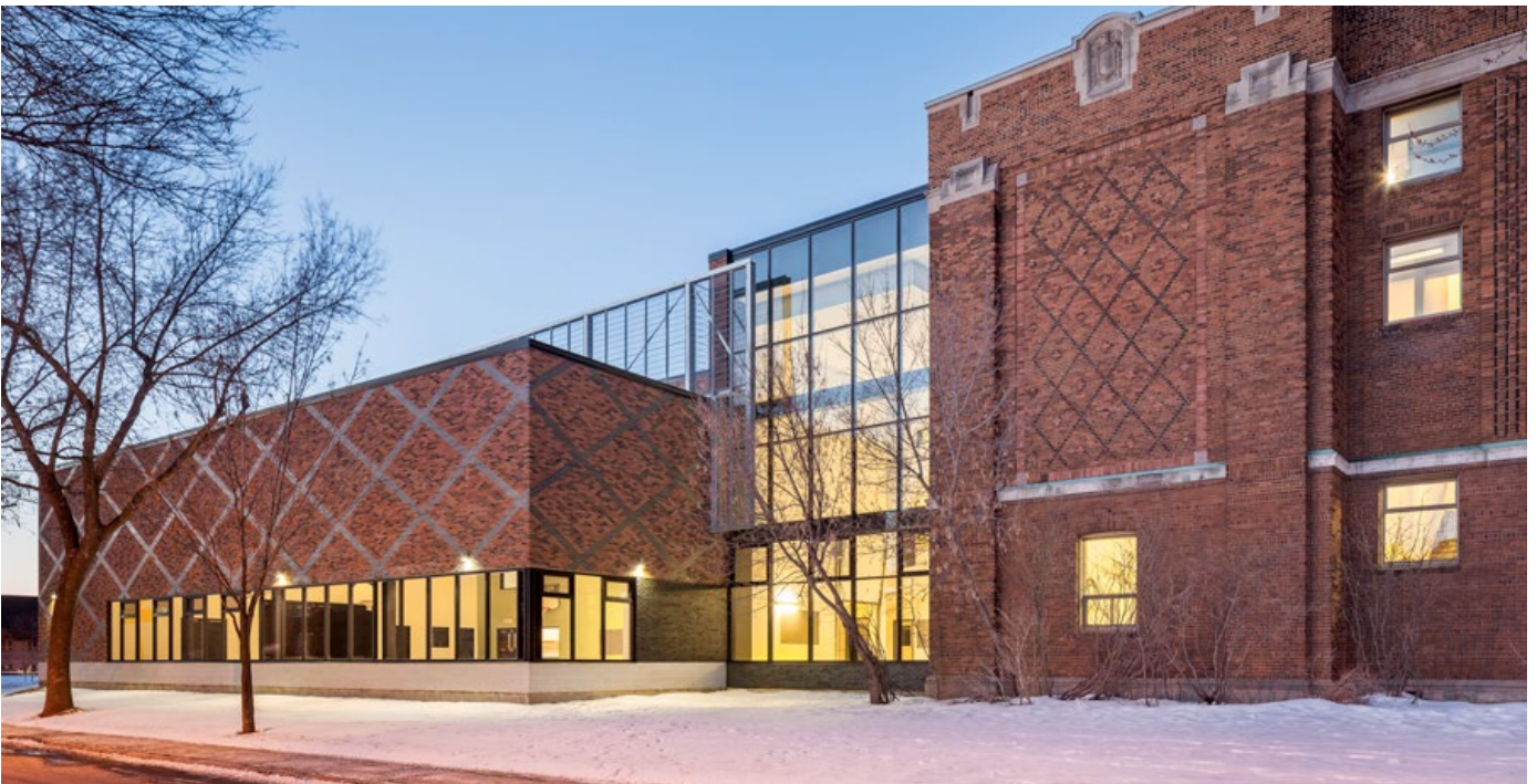
École Barclay | Agrandissement 2013 | Commission scolaire de Montréal