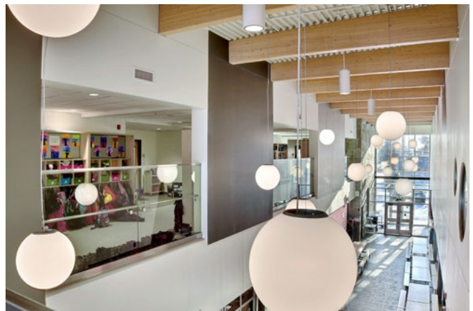
École primaire Horizon-du Lac, 2017 Commission scolaire de la Seigneurie-des-Mille-Îles Leclerc Architectes