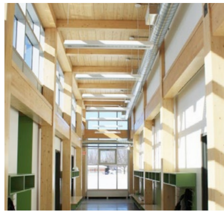
École primaire Everest | Agrandissement 2014 Commission scolaire Central Québec BGLA Architecture Design Urbain