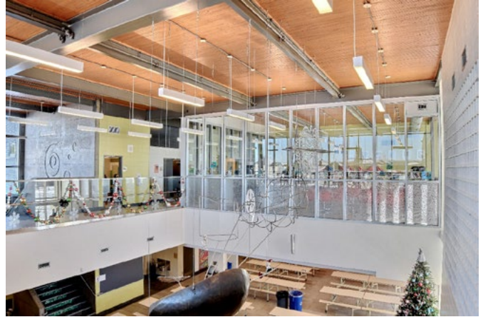
École primaire Des Grands-Vents, 2014 Commission scolaire de la Seigneurie des Mille-Îles VBGA et François Grenon architectes