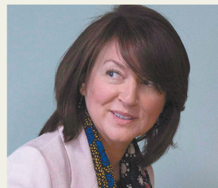
Nathalie Normandeau