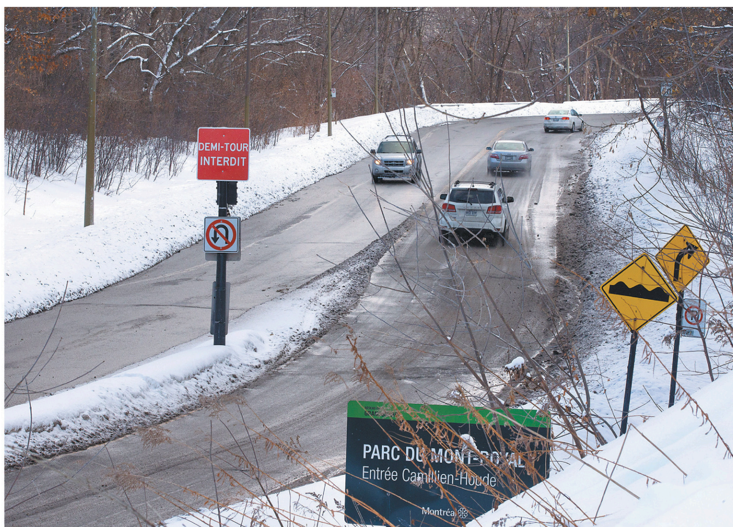
L'administration Plante compte un jour réaménager la voie Camillien-Houde pour la réduire aux dimensions d'un chemin du parc.