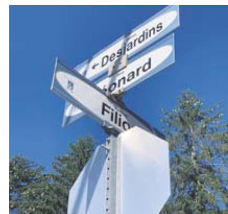
Les travaux de déboisement du projet domiciliaire du promoteur Landco ont commencé au nord de la rue Desjardins, angle Filion à Saint-Sauveur.