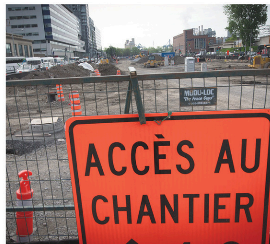
Ottawa souhaitait consacrer ces milliards à des projets de transport collectif ou de réseaux d'eau.