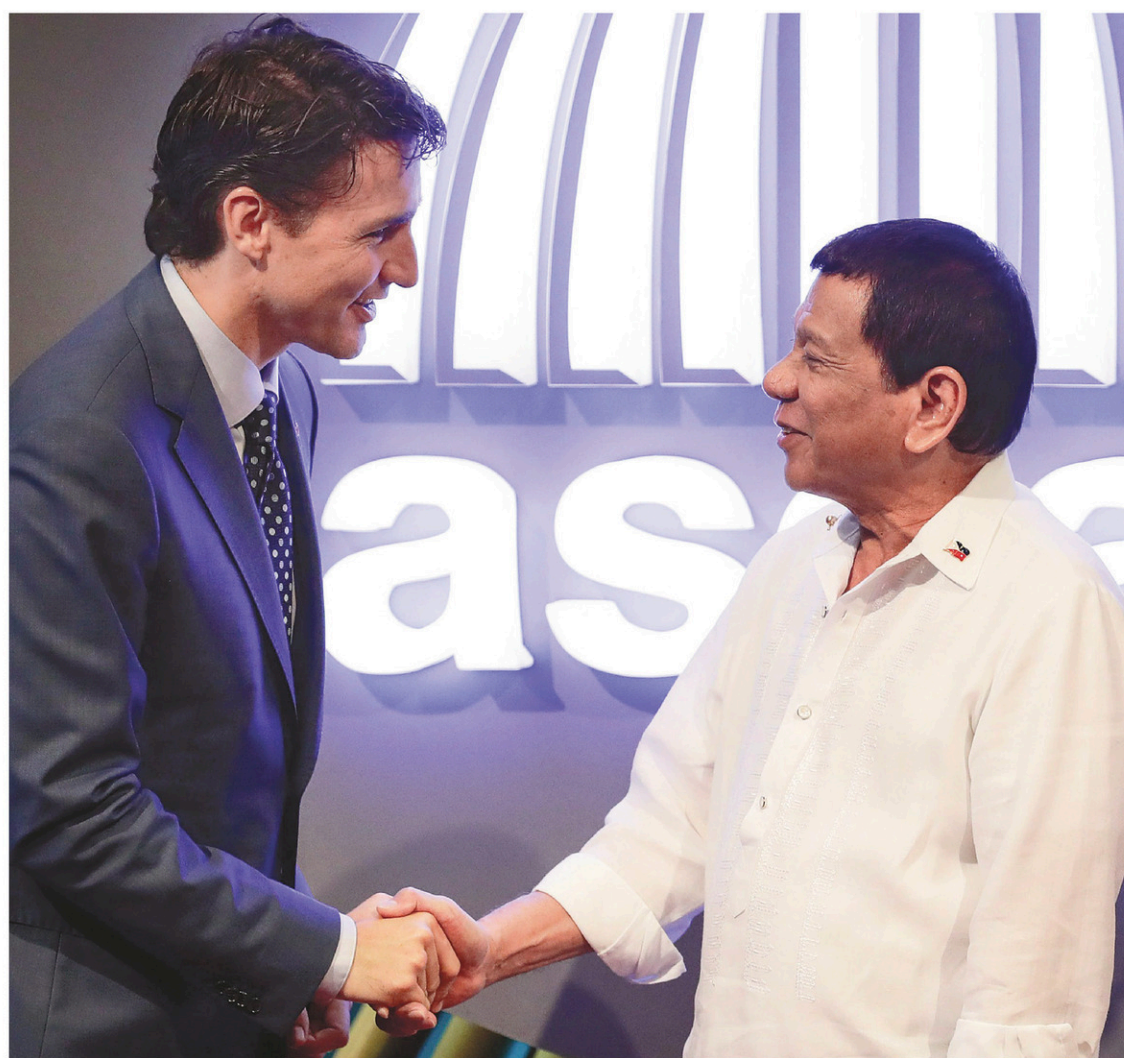
Justin Trudeau a échangé quelques mots avec le président philippin, Rodrigo Duterte, à l'ouverture du sommet de l'Association des nations de l'Asie du Sud-Est, lundi à Manille.