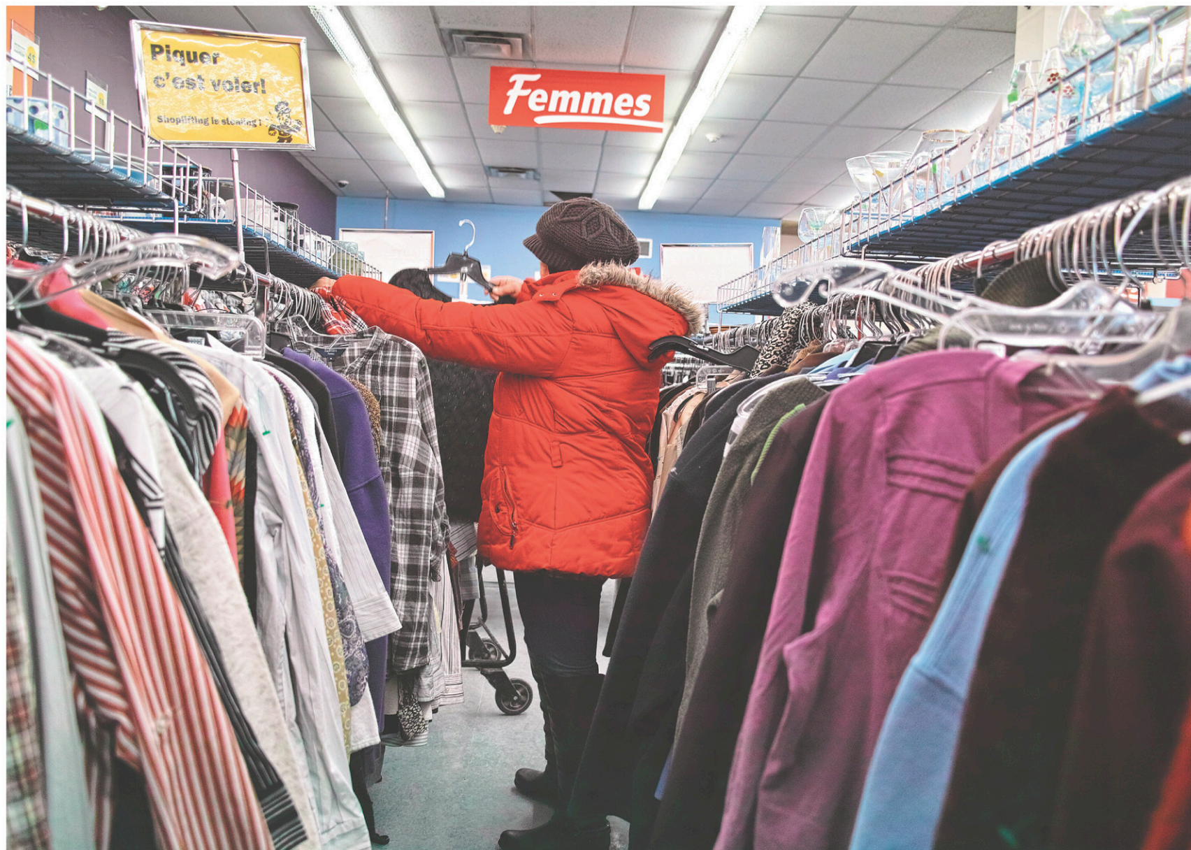
OLIVIER ZUIDA LE DEVOIR

Les personnes seules bénéficiant de l'aide sociale pourraient voir leurs prestations augmenter de 472 $ par an, si le gouvernement décidait de donner suite aux recommandations du comité d'experts qu'il a mandaté pour étudier la pertinence d'établir un revenu minimum garanti.