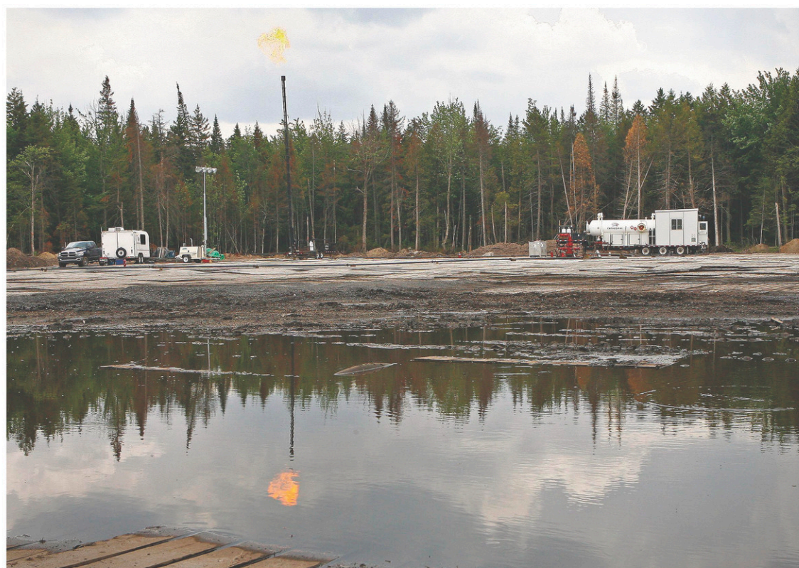
La possibilité de trouver des gisements conventionnels avec les seules techniques normales a toujours été très faible au Québec.

Comment concilier deux volontés bien oppo-