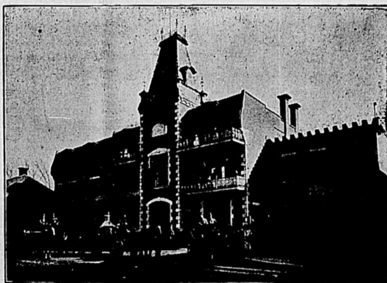
Station de Police et Feu