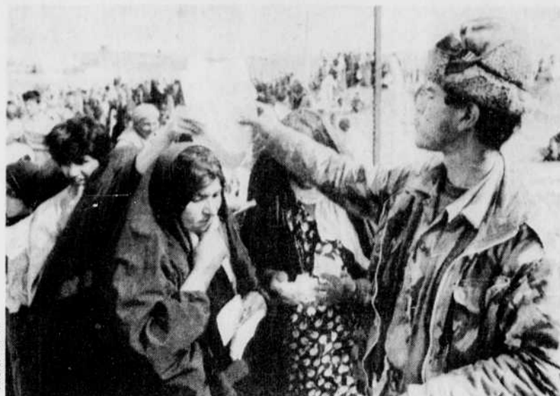
Exhibant leurs papiers d'identité à un soldat irakien, des réfugiés kurdes reviennent en Irak, après que Hussein leur ait promis l'amnistie.

Cette bande délimitée a été définie dans le cadre du cessez-le-feu permanent voté par les Nations unies. Elle s'étend sur 200 kilomètres de long et neuf de large de part et d'autre de la frontière — six à l'intérieur de l'Irak, trois à l'intérieur du Koweït.