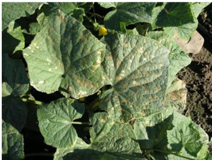
Feuilles de concombres avec lésions orangés angulaires

Pour les autres champs de concombre dont la récolte est terminée ou sur le point de l'être, il est essentiel de les détruire dès qu'elle sera complétée afin de ne pas laisser de plants sans protection fongique, car ceux-ci pourraient servir de source de contamination pour les autres champs.