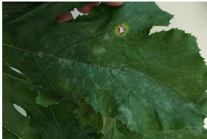
Symptôme de gale sur feuille de zucchini, Photo : Lucie Caron, agr. MAPAQ.