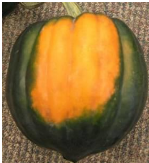
Courge poivrée mature

Pour ce qui est des courges kabocha, le bon moment pour amorcer la récolte se situe à environ 40 jours après la pollinisation.