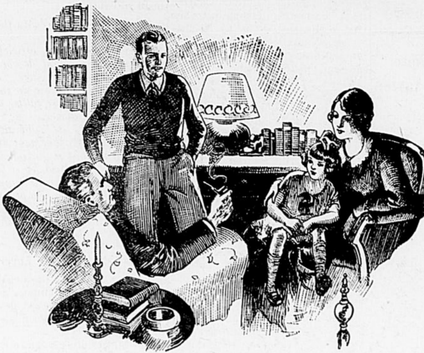
"Canada en avant!"

Partout dans le Canada, les Canadiens avancent, poussés par la vague envahissante d'une prospérité nouvelle et vigoureuse. Et la General Motors, voulant faire honneur au progrès canadien, présente "Le Canada en Parade", une heure de radiophonie toute canadienne, chaque vendredi soir. Nous vous invitons à vous tenir aux écoutes.