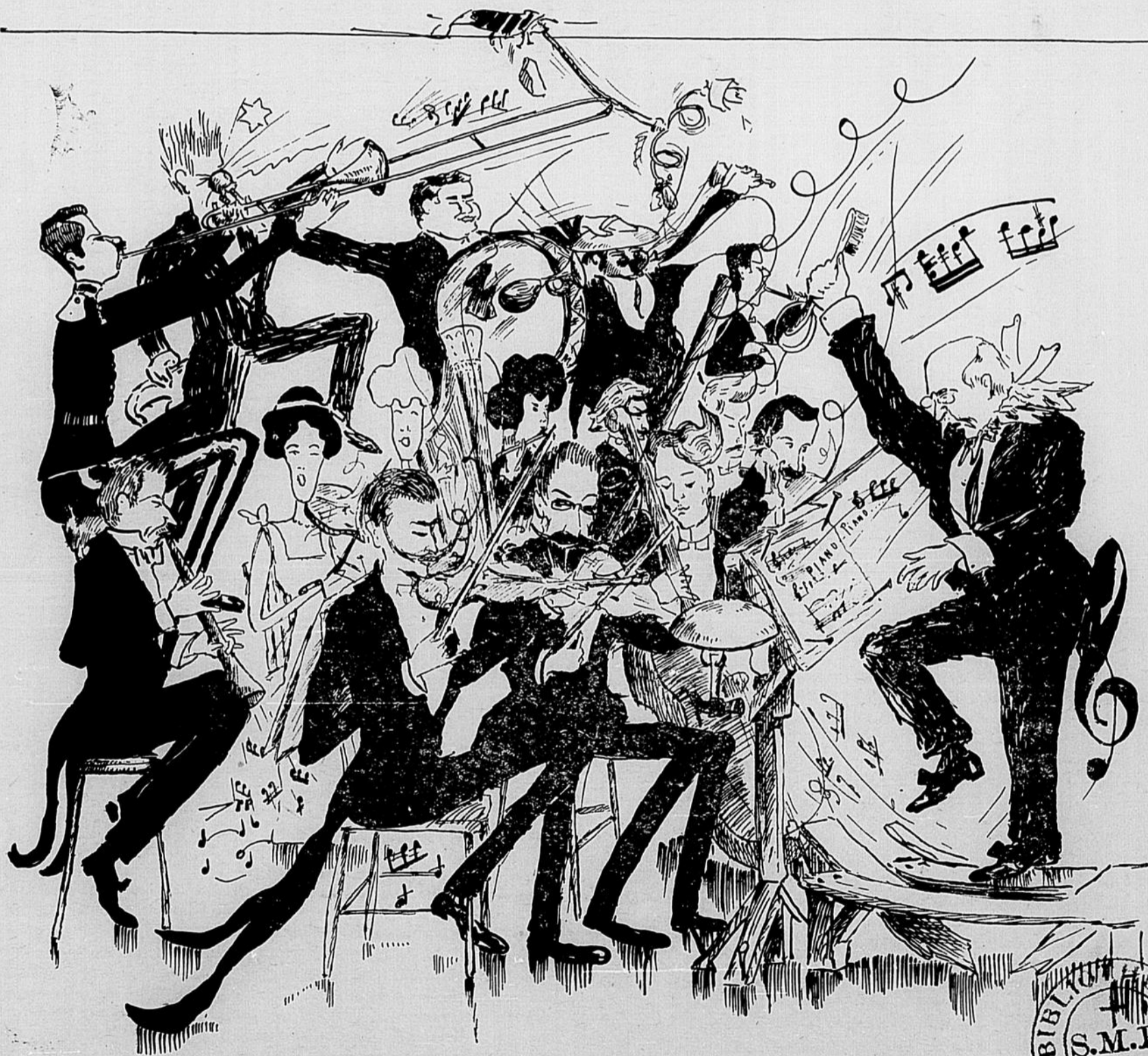
La Symphonie de Québec pendant l'exécution d'une mélodie, —