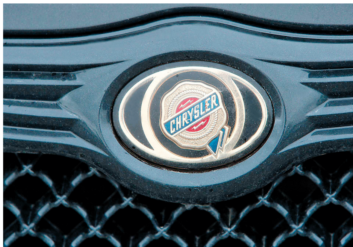
JACQUES GRENIER LE DEVOIR

Plusieurs nouveaux modèles sont en gestation chez Chrysler, sauvée par Fiat.