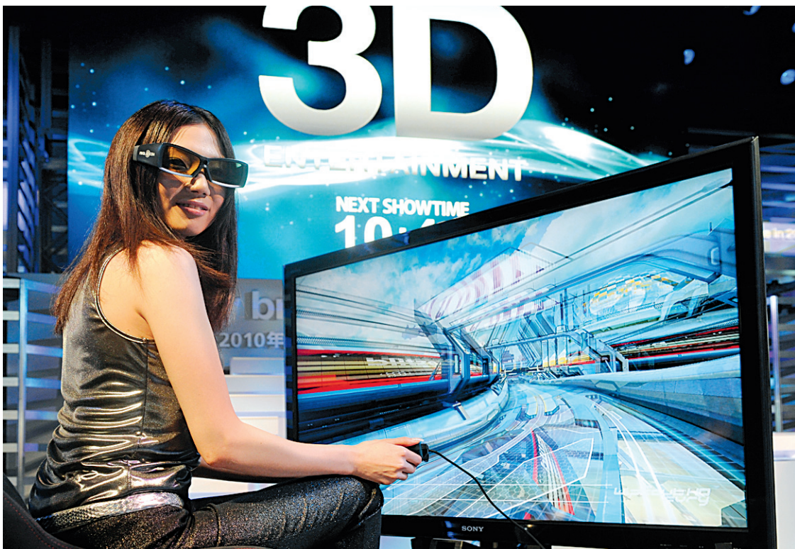
En octobre dernier, Sony dévoilait au Japon son premier téléviseur 3D.

En marge de cette quête des fabricants de téléphones pour trouver l'appareil qui fera rêver les masses, il y a aussi la réalité des consommateurs qui doivent s'abonner aux services d'un opérateur pour utiliser leur appareil cellulaire. Au printemps, Vidéotron fera son entrée dans les grandes ligues au Québec avec son propre réseau cellulaire évolué, son choix d'appareils et ses services. Est-ce que l'opérateur offrira une passerelle exclusive à