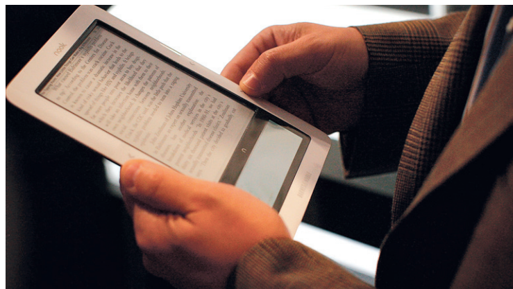
2010 sera aussi l'année du lecteur électronique. Sur la photo, le «nook» offert par Barnes & Noble's.