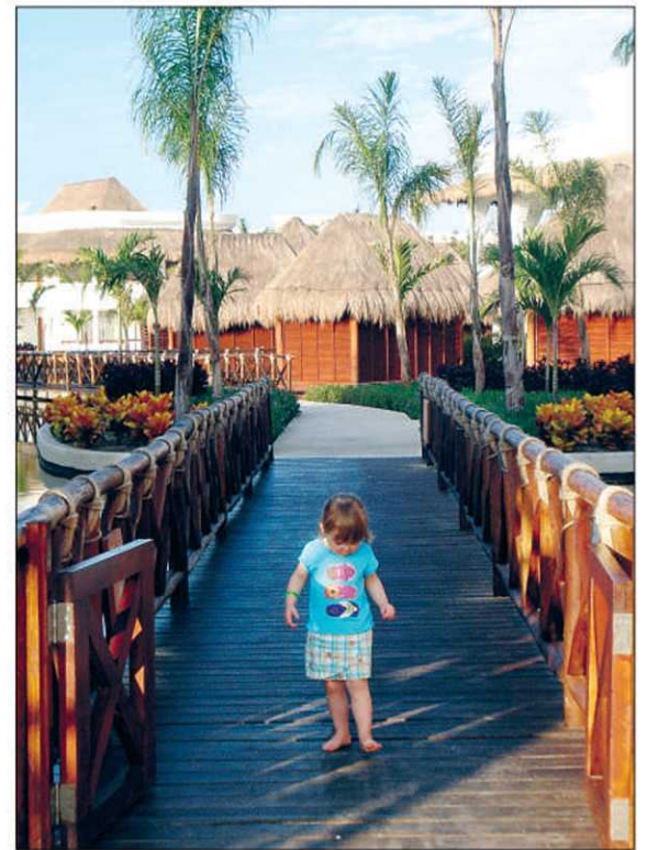
Pour voyager avec les petits, vaut mieux oublier la vision plage-mojito-dodo et la remplacer par des heures de plaisir à jouer dans le sable. — PHOTOS COLLABORATION SPÉCIALE GENEVIÈVE GOURDEAU

Geneviève Gourdeau Collaboration spéciale