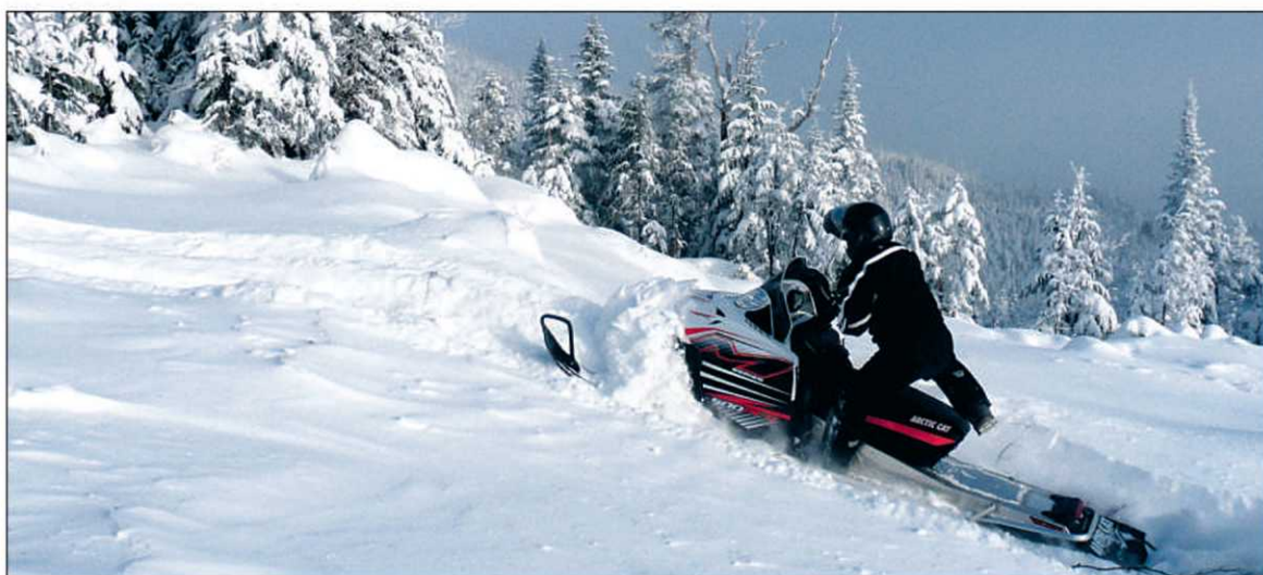
Le Circuit des Sommets est un nouveau parcours de 210 km autour du massif des Monts-Valin, au Saguenay. — PHOTO COLLABORATION SPÉCIALE YVES OUELLET

Informations : Club motoneige Caribou-Conscrit www.motoneigevalin.com