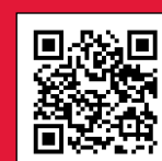
Graphisme: Interscript inc. Responsable de la production: Johanne Boucher Impression: Transcontinental Tirage: 2 700 exemplaires Dépôt légal: Bibliothèque nationale du Québec

Rédacteur en chef: Pierre Avignon Comité de rédaction : Pierre Girouard Secrétariat: Marie-Andrée Bousquet Design graphique: Denis Bernard Illustration : Paul Bordeleau