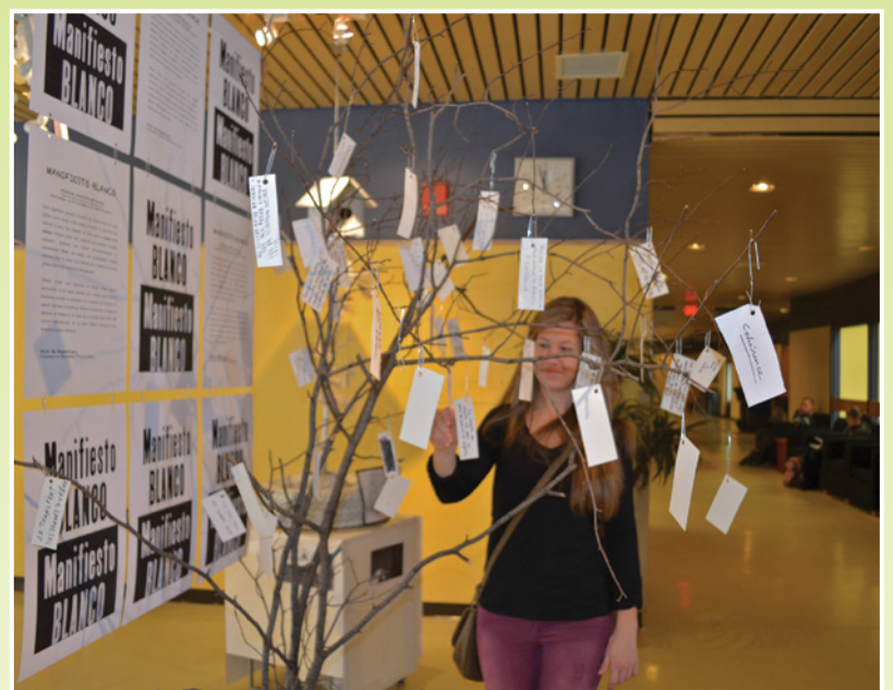
■ Activité Manifesto Blanco : une étudiante accroche son souhait pour un monde qui oppose la solidarité à la violence, la vie à la destruction et l'égalité à l'oppression.