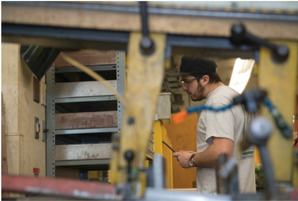
■ Atelier de génie mécanique, Cégep de Sorel-Tracy.

Sachant que la formation continue est un secteur en développement dans nos collèges, ce rapport constitue un