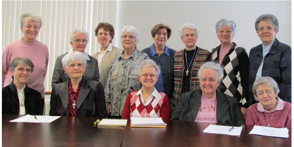
Québec, réunion du 7 février 2015