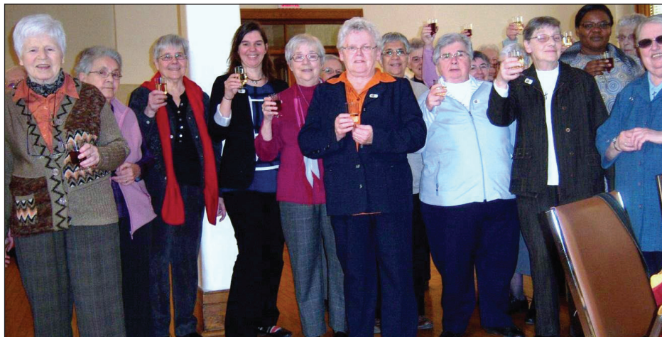
Montréal, 21 février 2015

Face à ce désengagement, quelles alternatives susciter? Élaborer des stratégies qui résistent à l'austérité parce que résister, c'est déranger; interpellier les élus politiques et les confronter à leur obstination. Mais comment renforcer notre pouvoir citoyen?