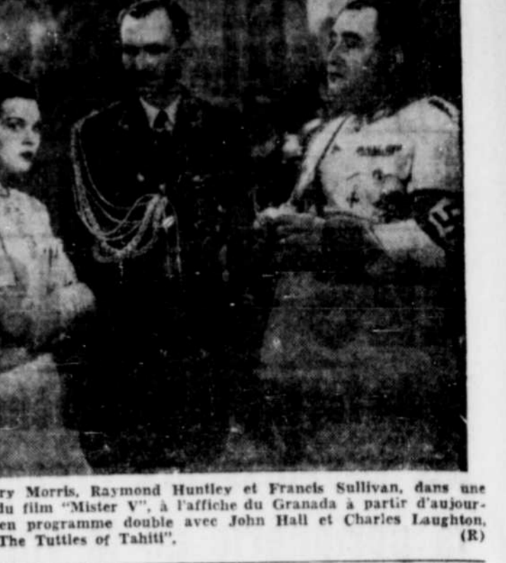
Mary Morris, Raymond Huntley et Francis Sullivan, dans une scène du film "Mister V", à l'affiche du Granada à partir d'aujourd'hui, en programme double avec John Hall et Charles Laughton, dans "The Tuttles of Tahiti".