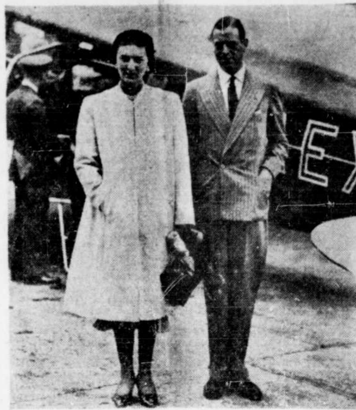
S. A. R. le duc de Kent a perdu la vie dans un tragique accident d'avion dans le Nord de l'Écosse. On le voit, ici, photographié avec son épouse, la charmante princesse Marina de Grèce, dans un avion, quelque temps avant son envol vers le Canada en 1940. Le duc de Kent était un fervent de l'aviation et prenait une part active aux développements de la guerre aérienne.