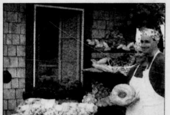
Christiane Côté et Pierre Duchesne: des pains pour toutes les bouches.

Vous avez un penchant pour les activités excitantes!