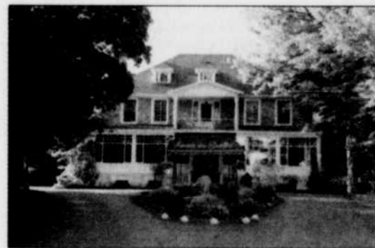
Le Manoir des Érables, à Montmagny: un haut lieu de la gastronomie.