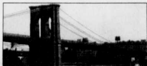
Le pont de Brooklyn

New York, comme bien des grandes villes, se visite idéalement à pied. Lors d'un séjour en autobus qui dure généralement trois jours, il faut s'attendre à faire des choix parfois douloureux car, chose évidente, on ne peut pas tout voir.