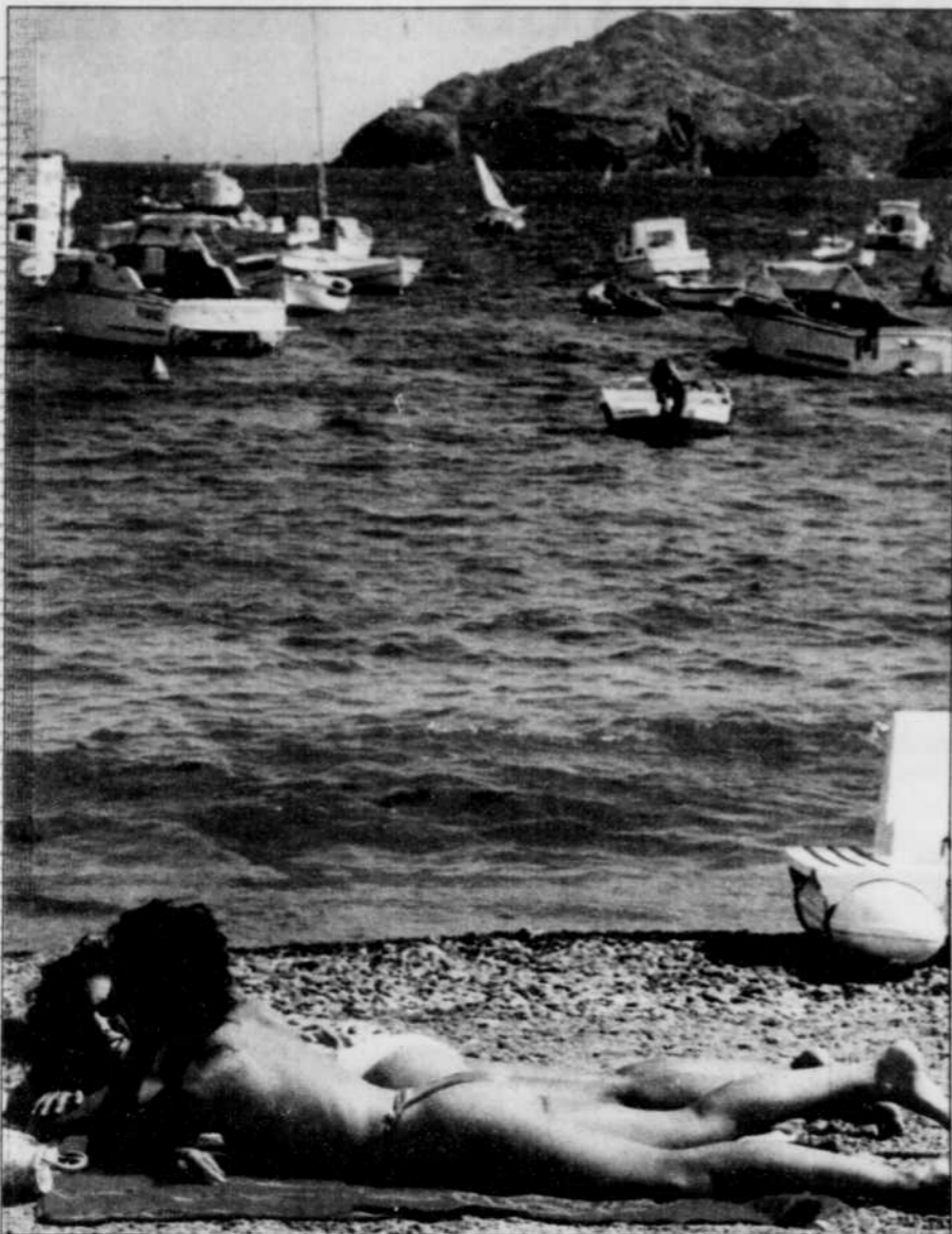
L'Espagne demeure un des rares pays d'Europe où les prix sont encore abordables.