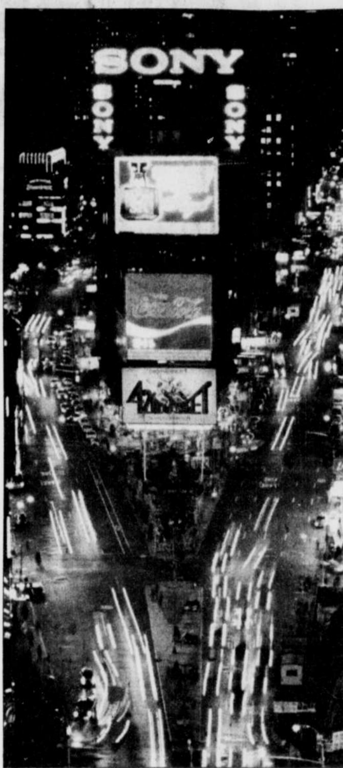
Les néons de Times Square: l'une des vues les plus impressionnantes lorsqu'on voit New York pour la première fois.