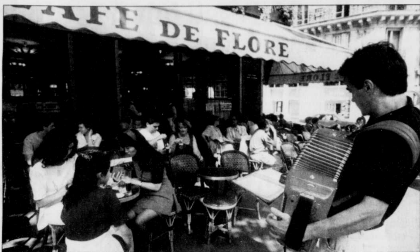
Le Café de Flore, à Saint-Germain-des-Prés.

Au café de Flore, centenaire, la terrasse permet toujours aux « fidèles clients de se retrouver, comme chez soi. Trotsky, puis Chou En-Lai y