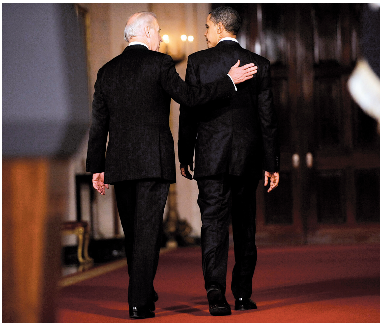
JONATHAN ERNST REUTERS

■ L'éditorial de Serge Truffaut, page A 8