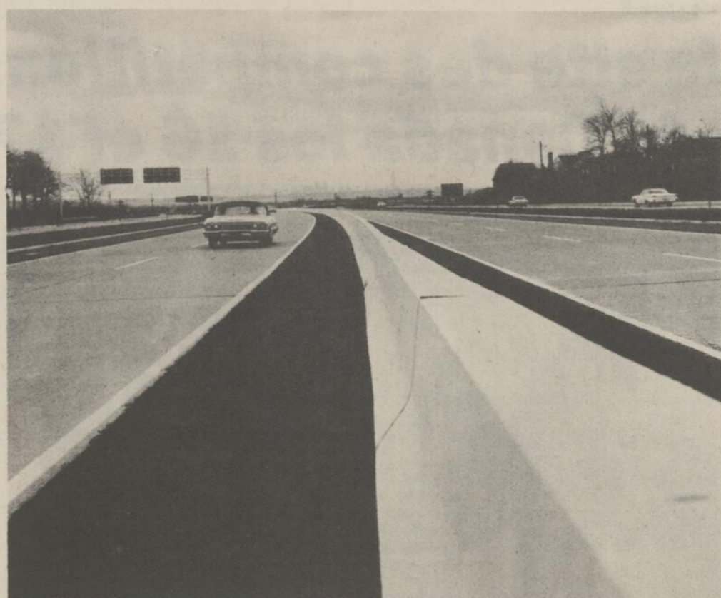
ELIMINATION DES COLLISIONS FRONTALES-- Le département de la recherche sur les autoroutes en Californie vient de mettre au point une barrière permettant d'éliminer tout danger de collision entre les véhicules circulant en sens contraire sur les autoroutes.