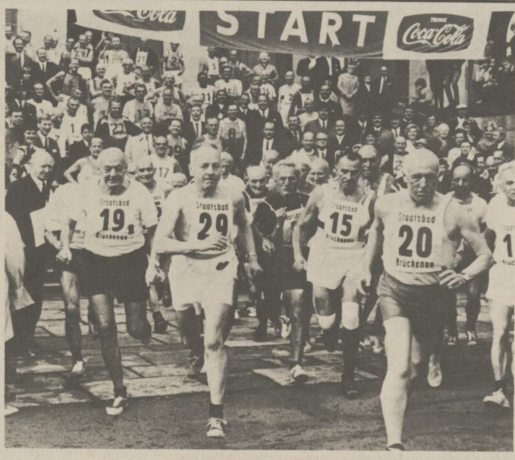
LES GRANDS-PERES sont encore dans le vent. Pour la seconde fois s'est déroulée en Allemagne de l'Ouest l'épreuve du 5,000 mètres réservée aux grands-pères. Les participants sont venus d'Allemagne, d'Autriche, de Suisse, de Suède et même de Colombie. A noter que le plus jeune était âgé de 55 ans et le plus vieux avait 78 ans. Quatre-vingt-neuf des 95 coureurs sont arrivés au but en bonne condition, quoique légèrement...essoufflés. Cette course ayant remporté un vif succès, on envisage d'organiser pour bientôt une course réservée aux grands-mères.