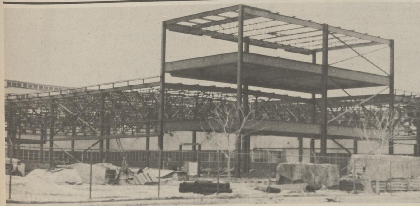
Les travaux d'agrandissement de l'usine Pirelli Cables située sur la rue Saint-Louis à Saint-Jean progressent normalement depuis quelques temps. Déjà, l'immense charpente d'acier est montée. On sait que ces travaux de construction sont effectués par la firme Pollock McGibbom, de Montréal, au coût approximatif de $2,000,000.

d'acier est montée. On sait que ces travaux de construction sont effectués par la firme Pollock McGibbom, de Montréal, au coût approximatif de $2,000,000.