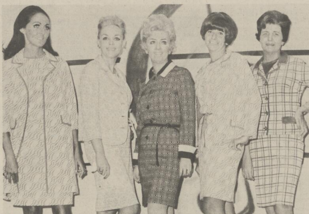
LES TRICOTS DE BROCCART auront la vedette au printemps 1968. Les mannequins nous en font voir quelques uns sur notre photo. De gauche à droite: robe et manteau assorti, robe ceinturée à la taille avec veste; deux-pièces en imprimé; l'ensemble jumeau du premier modèle illustré sur la gauche, et un deux-pièces à carreaux.

SAINT-HYACINTHE (DM)-- Les Filles d'Isabelle du Cercle Christ-Roi de Saint-Hyacinthe organisent une soirée de bingo qui aura lieu mardi le 5 mars, au sous-sol de la Cathédrale, à compter de 8 heures p.m. Il y aura tirage d'une courte-pointe et de plusieurs prix en argent. Pour renseignements supplémentaires, composez le numéro 774-4346. Bienvenue à tous les intéressés.