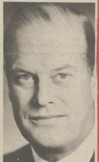
M. Robert WINTERS

Il a fait ses études à l'Institut de technologie du Massachusetts, pour travailler d'abord dans les laboratoires de la Bell, puis passa 12 ans aux Communies, avec feu M. W.L. Mackenzie King et l'ancien premier ministre, M. Louis Saint-Laurent.