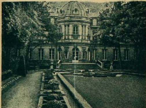
Pension ecclésiastique, Paris.

Les personnes qui auraient reçu des faveurs par l'intercession du Père Eugène Prévost sont instamment priées de les faire connaître au Supérieur de la Fraternité Sacerdotale, 32, rue de Babylone, Paris.