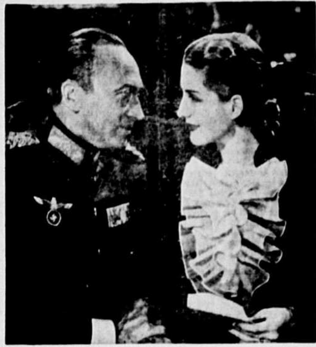
Conrad Veidt et Norma Shearer dans une scène de "Escape", film qui présentera demain le cinéma Loew's. Robert Taylor fait aussi partie de la distribution.