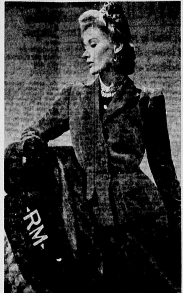
Ensemble de velours de soie rouge clair porté avec une blouse de jersey de soie noirs. Le petit chapeau à la pompadour est de velours noir brodé de fil d'or. Ce deux-pièces est tout indiqué pour un thé ou un cocktail.

elle avait pensé livrer le détective à la pieuvre? La seconde erreur était la conséquence de la première. Déjà ébranlée par le drame qui venait de se dérouler sous ses yeux, bouleversée par la mort de son fils et épuisée par le combat qu'elle venait de livrer au monstre, la hideuse vieille se sentit tout à coup entourée de dangers mystérieux. Une terreur superstitieuse s'empara d'elle. Peut-être se dit-elle que l'heure du châtiement de ses crimes venait de sonner. Hagarde, elle promena autour d'elle ses regards terrifiés. Ce fut à cet instant qu'elle découvrit Charleval, qui la tenait sous la menace de son revolver. Celle vue réveilla en elle l'instinct de la bête traquée. Elle voulut fuir et se jeta instinctivement sur la corde, le long de laquelle elle se hissa avec une agilité de guénon. Mais, derrière elle, Charleval s'était élancé et grimpait aussi. Il ne voulait pas laisser échapper la mère Oursin. Il ne voulait pas qu'elle put donner l'alarme et permettre aux complices qui pouvaient exister encore de s'enfuir. C'est pourquoi, sans lâcher son revolver, il avait empoigné la corde et se hissa, à la suite de la mère Oursin, en s'aider des jambes et de sa main libre. Merveilleux gymnaste, il égalait presque l'agilité de la vieille, dont il