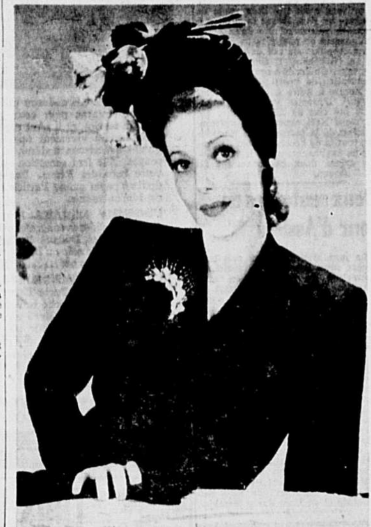
Loretta Young porte bien ce turban de cachemire noir orné de tulipes roses qui traversent des anneaux de satin noir.