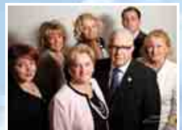
Une entreprise familiale Groupe Savoie