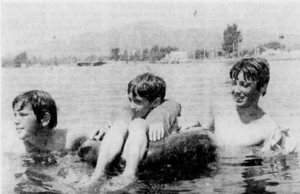
L'été est là, la plage de la Pointe Merry s'en rend bien compte à Magog... les enfants aussi.

Mentionnons que c'est ce nouveau taux qui a servi de base aux comptes de taxes scolaires envoyés tout récemment.