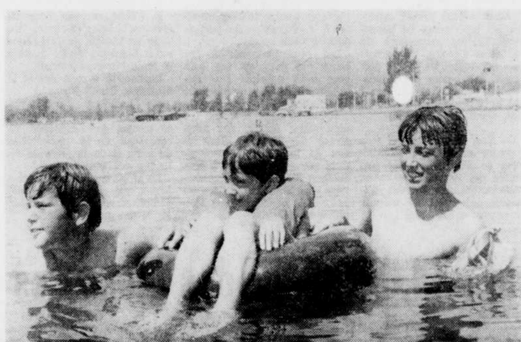
L'été est là, la plage de la Pointe Merry s'en rend bien compte à Magog... les enfants aussi.