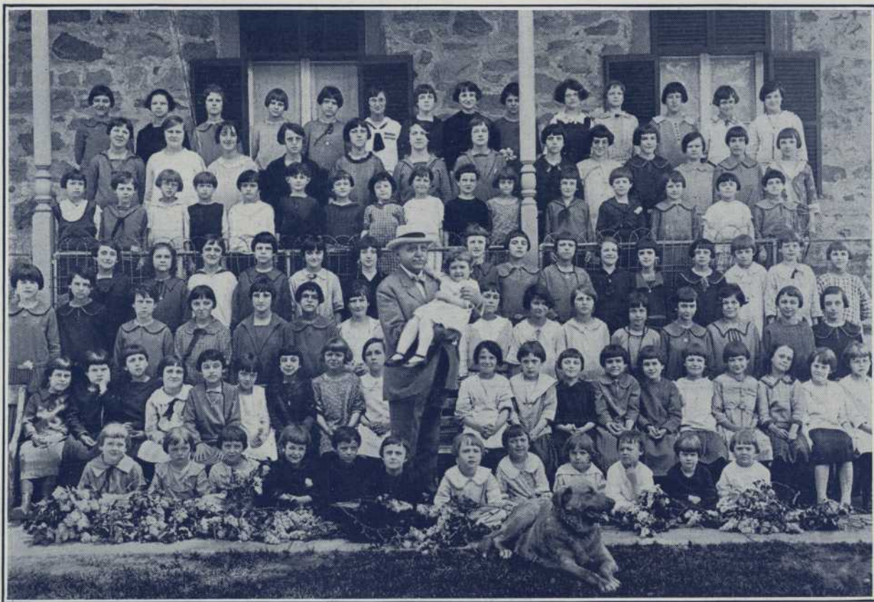
Cette image du grand philanthrope canadien-français au milieu de ses petites protégées, en compagnie de son fidèle chien "Jessie", l'ami de toutes les orphelines, en dit plus long que tous les éloges qui pourraient être décernés à l'oeuvre humanitaire entreprise par l'Hon. Sénateur depuis de nombreuses années.