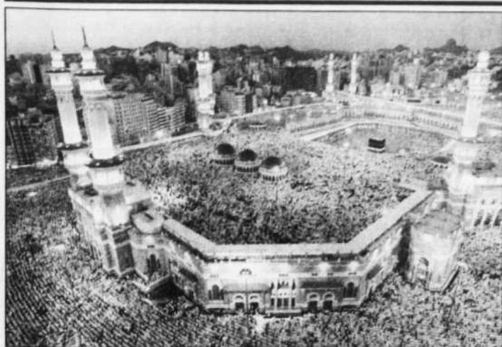
La grande mosquée au coucher du soleil.