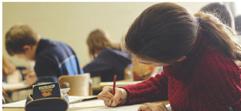
La proportion de la population n'ayant aucun diplôme s'élève à 14,7% dans la région comparativement à 9,7% dans l'ensemble du Québec.