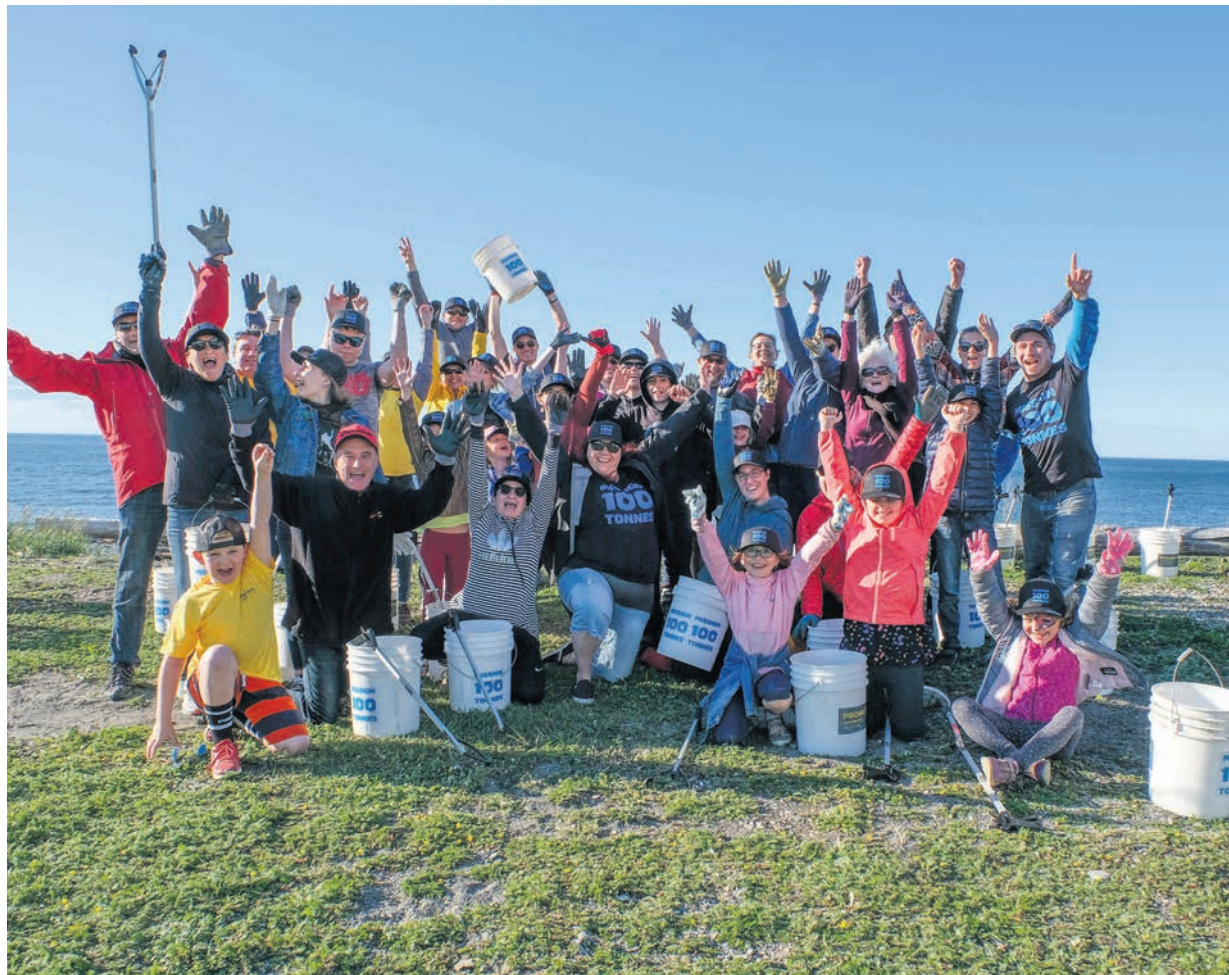
L'équipe d'Expédition Saint-Laurent devait être de passage sur les berges de Rimouski et de Matane les 10 et 11 août derniers.

L'expédition comprend également un volet scientifique, avec des échantillonnages qui seront effectués dans le Saint-Laurent. «Il existe encore peu d'études sur la quantité de microplastiques présente dans le fleuve. L'un des objectifs de l'expédition est d'aller chercher des données sur le terrain. On va principalement aller chercher des données sur les sédiments, afin de voir la quantité de microplastiques qui se retrouve sur les berges, un peu partout dans le Saint-Laurent. On veut aussi caractériser les déchets retrouvés, c'est-à-dire qu'on veut comprendre quels types de déchets se retrouvent un peu partout au Québec», précise le directeur général de Stratégies Saint-Laurent qui se dit préoccupé par l'augmentation du plastique dans le cours d'eau de près de 2 000 kilomètres. Selon Statistique Canada, les Canadiens jettent chaque année des articles renfermant environ quatre millions de tonnes de plastique, dont seulement 8% sont recyclées. «Dans les