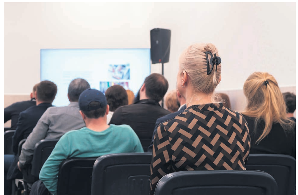
Le seul critère pour l'inscription : avoir plus de 50 ans.

Comme le souligne la directrice, « le plaisir d'apprendre, c'est aussi le plaisir de s'engager et d'enseigner » - un engagement qui favorise la création de nouvelles amitiés et le maintien d'un réseau social actif, essentiel après la retraite.