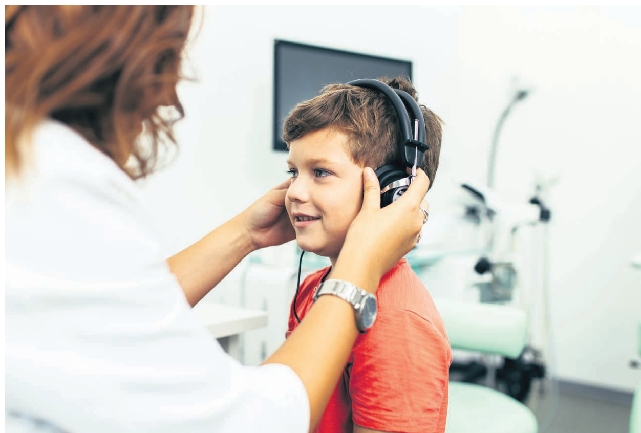
Les problèmes de vision et d'audition sont à prendre sérieusement.

L'infirmière souligne que ces spécialistes peuvent aider à identifier et à traiter des préoccupations telles que «problème de la vision, de l'audition, bruxisme relié à l'anxiété».