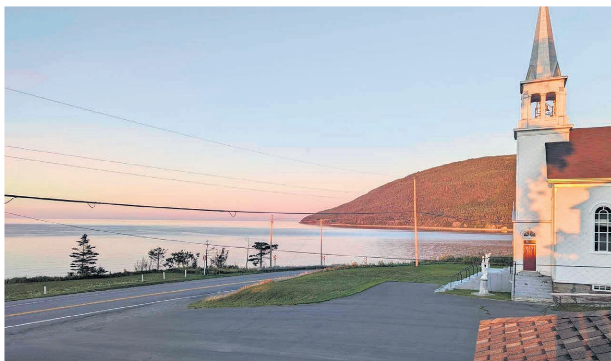
L'église de Rivière-à-Claude a été construite en 1926-1927.