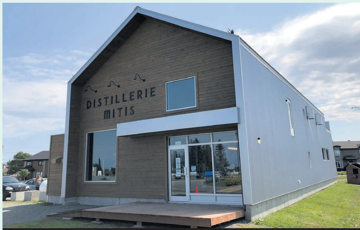
La Distillerie Mitis existe depuis cinq ans à Mont-Joli.