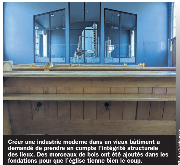
Créer une industrie moderne dans un vieux bâtiment a demandé de prendre en compte l'intégrité structurelle des lieux. Des morceaux de bois ont été ajoutés dans les fondations pour que l'église tienne bien le coup.

La passion pour l'histoire de l'entrepreneur se traduira aussi par des visites historiques des lieux, guidées par