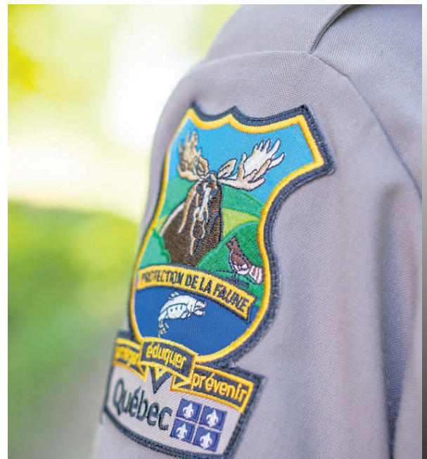
On compte moins de 20 agents de la faune en Gaspésie, selon le syndicat.