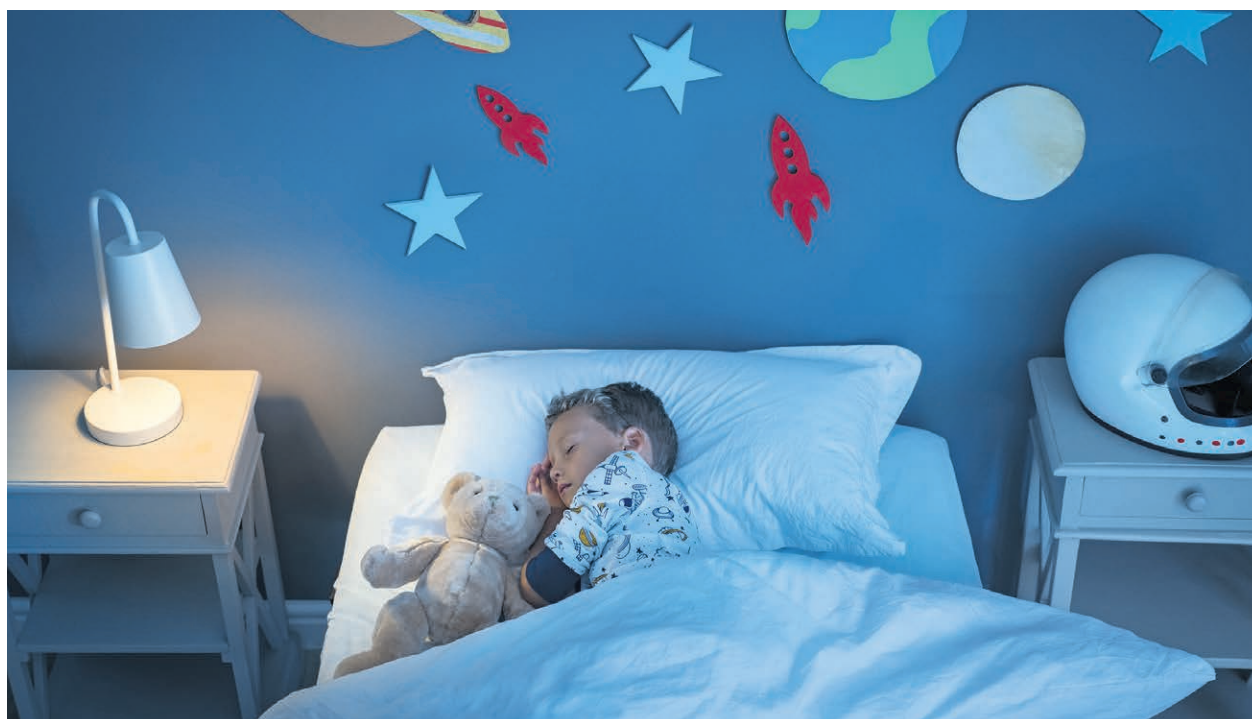
Le manque de sommeil affecte négativement les capacités cognitives.

Les habitudes de vie modernes, notamment l'utilisation des écrans, peuvent également perturber le sommeil des enfants.