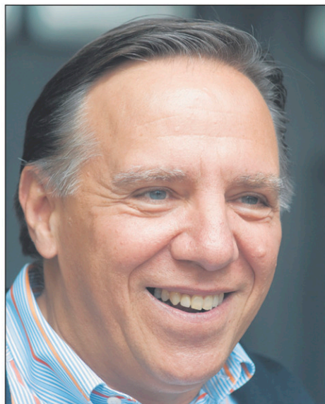
François Legault sera le premier des trois chefs à venir rencontrer les gens d'affaires de la région.

C'est M. Legault qui partira le bal le vendredi 27 avril, dès 11h45, au Quality Hotel (725, boulevard du Séminaire Nord).