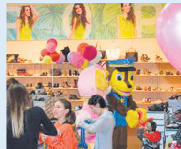
Toute l'équipe de Chaussure Pop en pleine action.