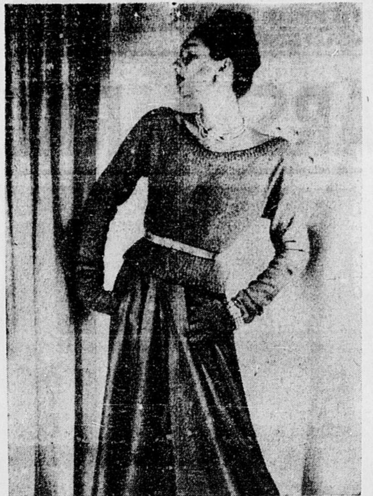
Encore du nouveau pour le soir, c'est un chandail de Bruno, à manches longues avec gracieux décolleté arrondi et uni à une jupe circulaire en laine et à une étroite ceinture de cuir argent. C'est très charmant et confortable.