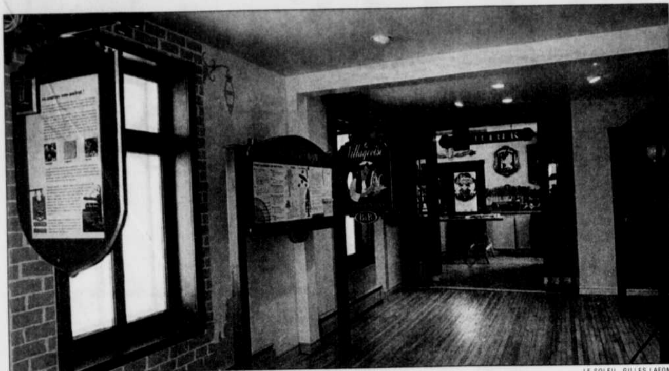
Une vue de salle d'exposition à l'Enseignerie, située aux limites de Lévis et de Beaumont.