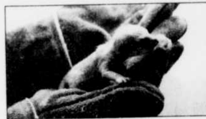
Petit suricate, né le 3 mars à Granby.

Il paraît que les suricates ont un esprit de famille particulièrement élargi puisque le gardiennage des petits est une préoccupation de tous les adultes du groupe. Les nouveau-nés ne feront que rehausser l'intérêt du public pour cette espèce déjà très populaire lors de l'été africain qui est en préparation et dont le clou sera l'inauguration du pavillon AFRIKA destiné à abriter un groupe de gorilles et d'autres animaux de la forêt tropicale africaine. T.D.