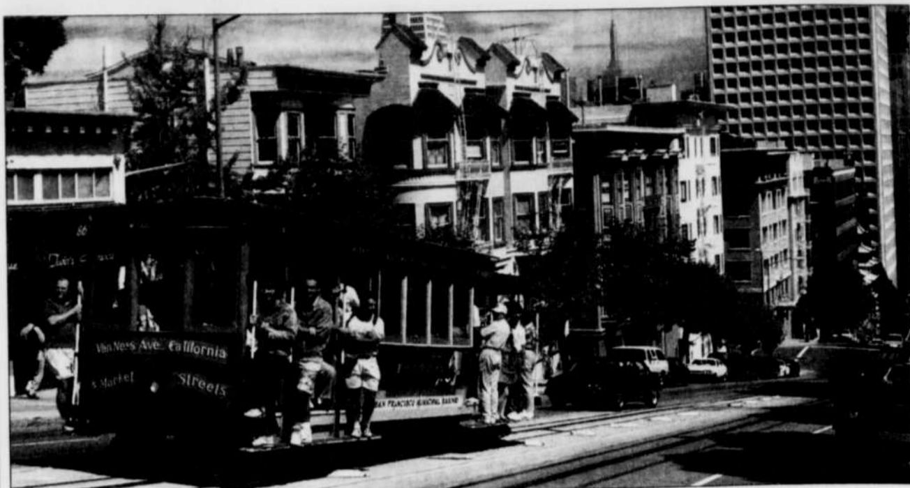
Les touristes adorent visiter San Francisco à bord de ces petits tramways particulièrement mignons.

tournée en Amérique latine. En Argentine, Accor devrait investir 100 millions $ pour la mise en place d'une chaîne hôtelière à l'intérieur du pays, plus particulièrement destinée aux hommes d'affaires, ainsi que pour un complexe situé à Puerto Madero dans le secteur du vieux port de Buenos Aires. Le groupe français, allié au constructeur local Benito Roggio, a participé à l'appel d'offres pour la construction d'un complexe hôtelier à Puerto Madero pour 45 millions $. (AFP)