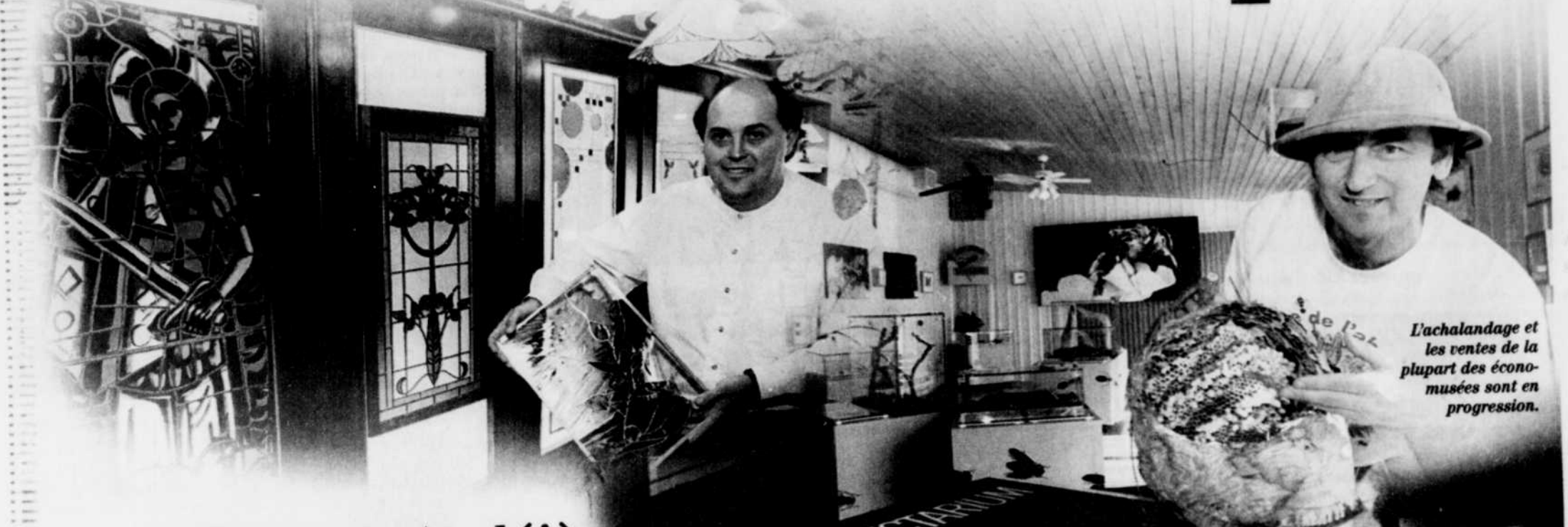
L'achalandage et les ventes de la plupart des économusées sont en progression.

On compte déjà 15 de ces petits centres d'interprétation animés et bientôt 24 cet été