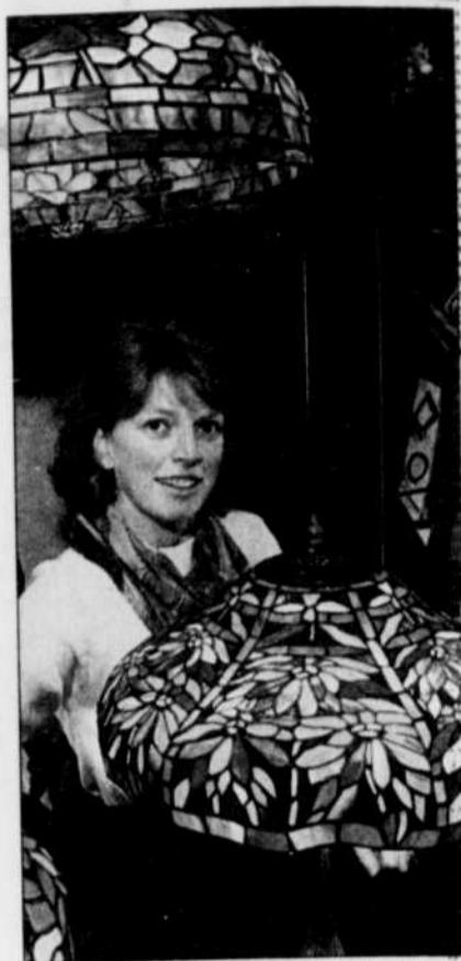
Des artisans qui ont l'amour du métier et du plaisir à le partager.

Avant d'accorder une accréditation et de supporter la mise en place d'un économusée, des consultations sont menées auprès des organismes régionaux de développement économique et touristique et auprès des organismes culturels.