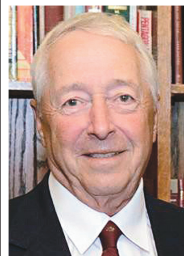
LA PRESSE CANADIENNE