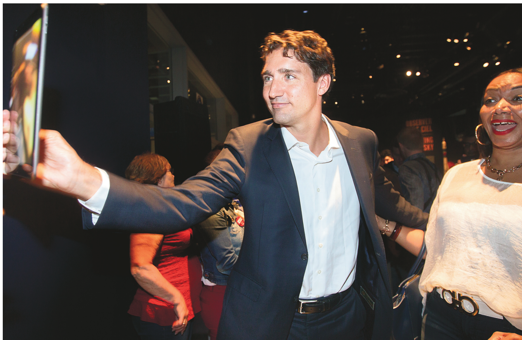
Même si la campagne électorale fédérale n'est pas encore officiellement déclenchée, les chefs de parti multiplient les activités publiques. C'est le cas du chef du Parti libéral du Canada, Justin Trudeau, qui était de passage à Laval et Montréal mardi.