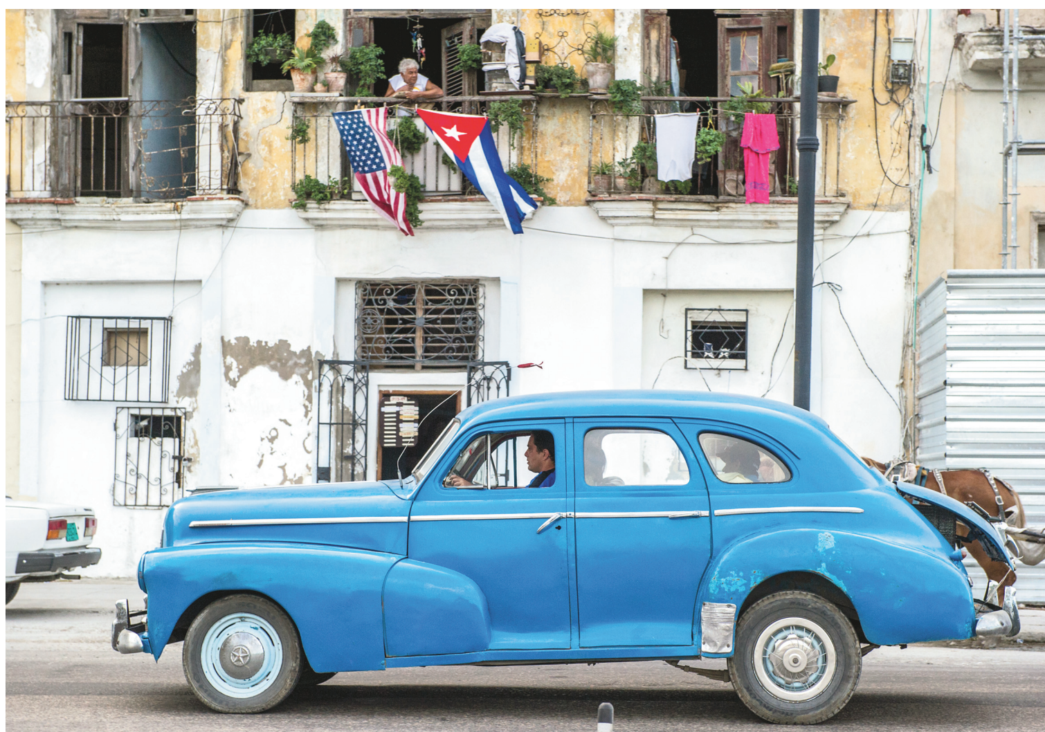
Aux yeux du monde et des amoureux de châssis d'un autre temps, Cuba est un paradis de guimbardes américaines.