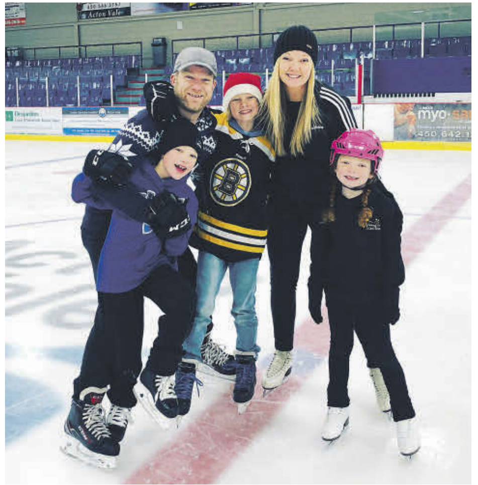
Le Centre sportif d'Acton Vale sera ouvert aux Valois au cours de la semaine de relâche.