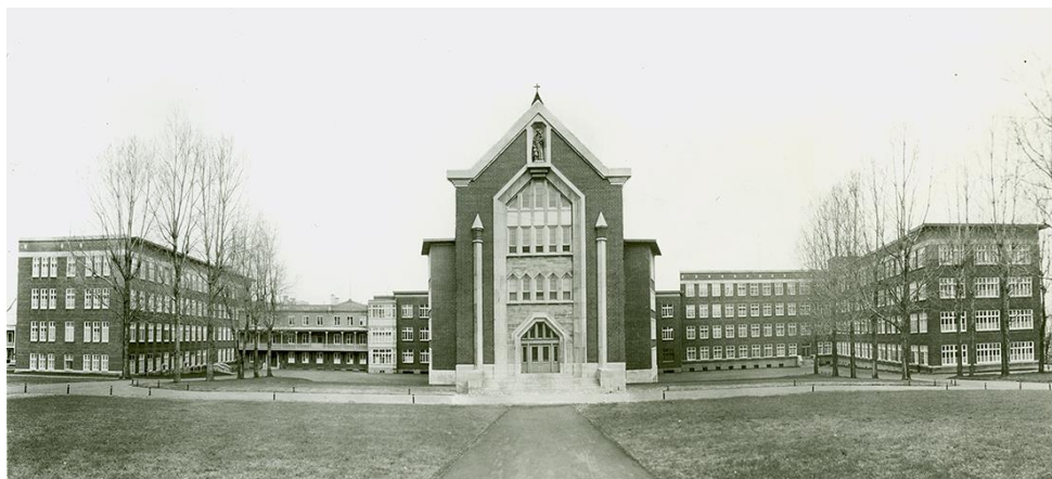
Figure 1. Crèche Saint-Vincent-de-Paul