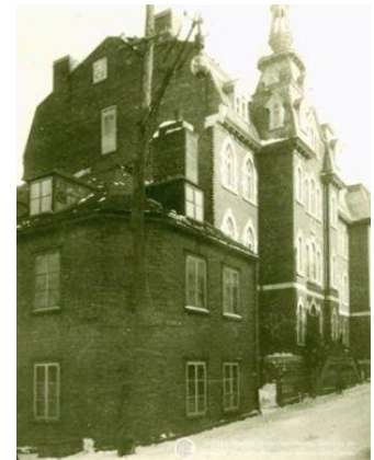
Hospice de la rue Couillard