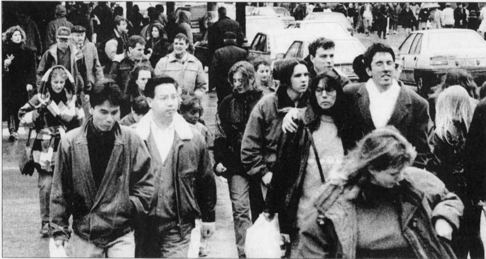
Conséquence de l'affaiblissement de son poids démographique au Canada, le Québec n'aura droit à aucun des sept députés que comptera le Parlement après les prochaines élections générales.

«Quand on pense qu'il y a 275 millions de personnes, il y a 534 membres du Congrès et 100 sénateurs, peut-être [y a-t-il lieu de s'interroger], mais je ne crois pas qu'on en soit là en ce moment. Je crois que c'est lorsqu'on attendra des nombres plus importants [que la question se posera].»