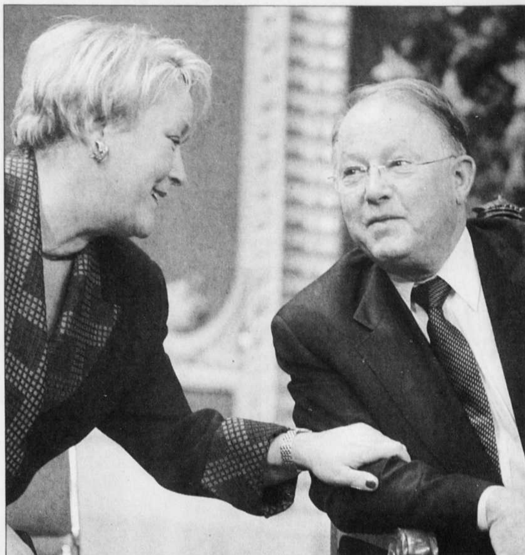
La ministre des Finances, Pauline Marois, et le premier ministre Bernard Landry.

M. Landry n'a pas exclu que le Québec s'adresse aux tribunaux pour contester, en vertu de la Constitution, le pouvoir fédéral de dépenser, une avenue évoquée par la commission Séguin. Ce sont des thèses « vieilles comme le monde », a dit M. Landry. Mais il serait plus intéressant d'engager une telle contestation avec d'autres provinces, a indiqué le premier ministre.