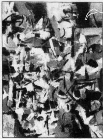
© JEAN-PAUL RIOPELLE - SODRAC (MONTREAL) 2002