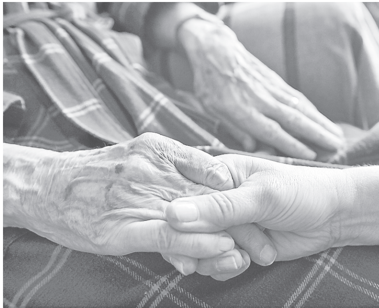
Les préposées aux bénéficiaires de la Coopérative des services à domicile de l'Estrie sont importantes autant pour les bénéficiaires que pour leurs aidants naturels.

« Elles sont tout le temps au-devant de ses gestes. Elles le surveillent, elles sont là pour son confort, je ne suis pas