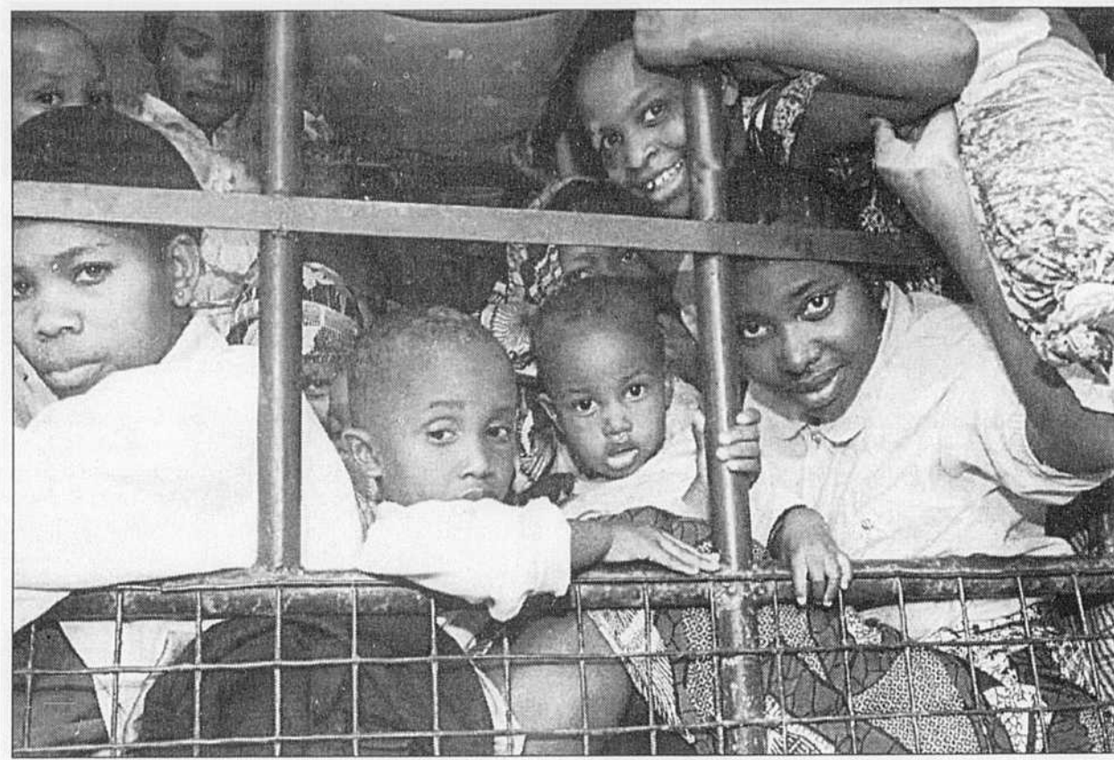
De jeunes enfants hutus entassés dans un autobus ont quitté hier Butare pour la ville de Gikongoro.

Nicosie (Reuters) — Les autorités iraniennes ont annoncé hier que les forces de sécurité iraniennes avaient déjoué des tentatives d'attentat à la bombe contre le tombeau de Fayatollah Khomeini, dans le sud de Téhéran, et un sanctuaire chiite de la ville sainte de Qom. Deux membres du mouvement d'opposition des moudjahidin du peuple ont été arrêtés, a rapporté la télévision iranienne. Au mausolée de l'imam Khomeini, la sécurité a arrêté une femme après avoir découvert dans son sac une bombe contenant 2,5 kg d'explosifs, écrit l'agence nationale Irna. Elle avait l'intention de la laisser près du tombeau pour qu'elle explose pendant les prières du soir, ajoute l'agence.