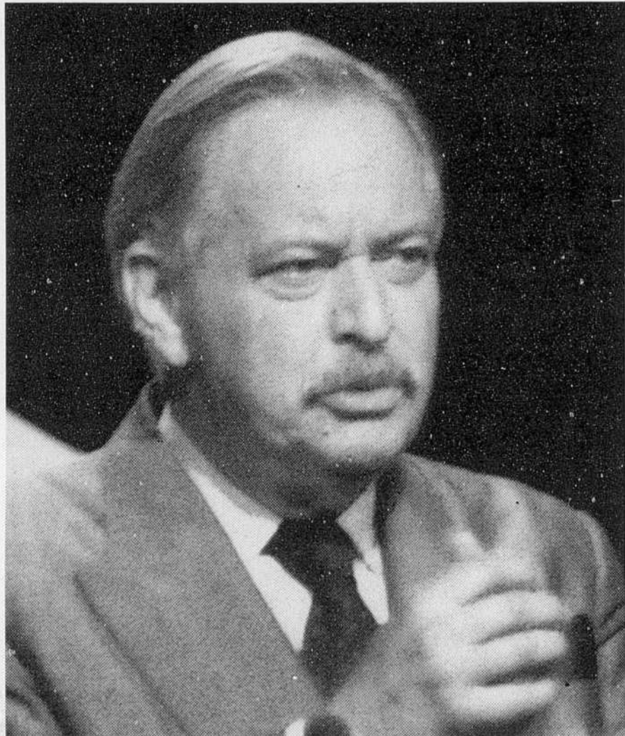
Jacques Parizeau, Chef du Parti Québécois et chef de l'opposition

Le Parti québécois affirme que, dès son arrivée au pouvoir, il estime avoir le mandat d'enclencher le processus d'accession du Québec à la souveraineté.