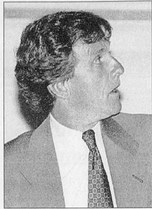
Allan Rock: «un processus».

«Le ministre Rock me l'a lui-même avoué: le Québec est très en avance dans ce dossier. On sait déjà ce qu'il faut faire en matière de prévention. Qu'est-ce que ce comité va nous permettre de découvrir de plus?» s'est interrogé le député Michel Bellehumeur lors d'un entretien téléphonique.