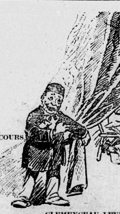
CLEMENCEAU LEVE LE RIDEAU.