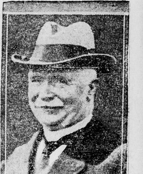
Le premier ministre MASSEY qui vient d'être réélu chef du gouvernement Nouveau-Zélandais. Tous ses ministres ont été réélus, à l'exception de un, dont le vote a été égal à celui de son adversaire.