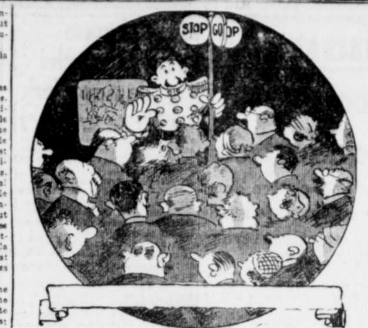
L'ancien agent de la circulation de venir au cinéma.