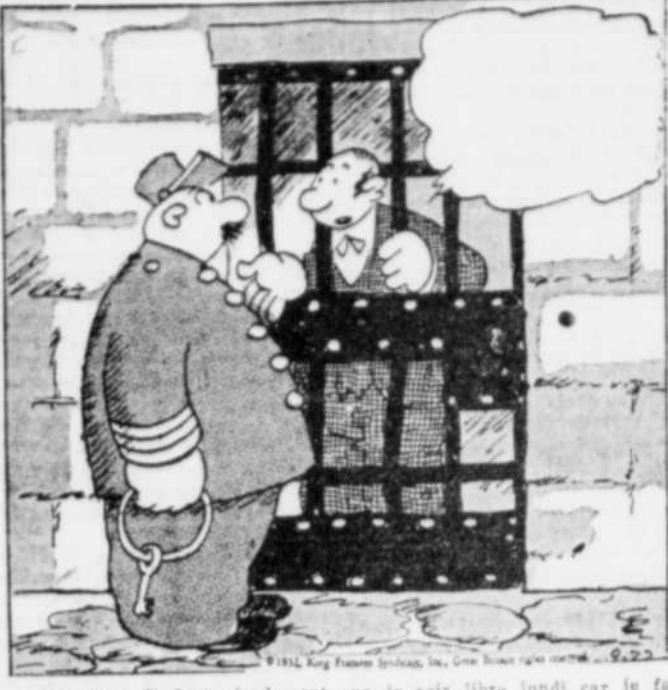
Le prisonnier — Il faut absolument que je vois libre lundi car je fais partie du prochain jury.

Text discussing the positive market movement in New York.