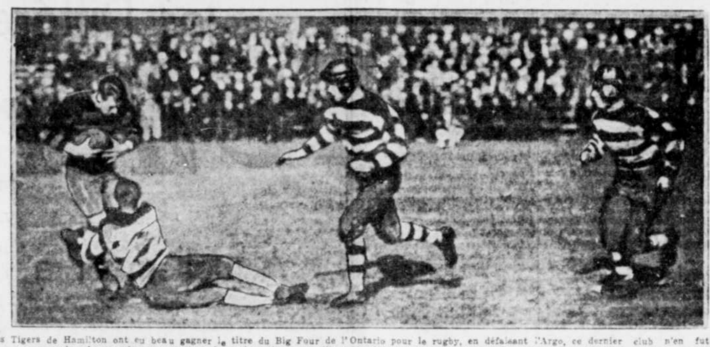
Les Tigers de Hamilton ont vu leur beau gainner le titre du Big Four de l'Ontario pour le rugby, en défilant l'Argo, ce dernier club n'en fut pas moins le premier à compter. Les adversaires surveillent étroitement leur ancien copain comme on peut s'en rendre compte.