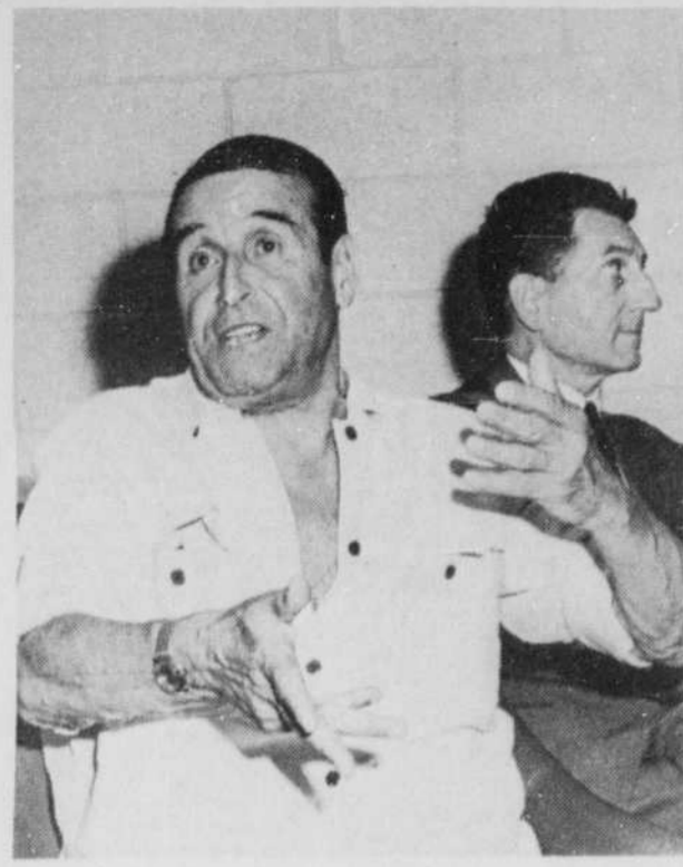
Le cinéaste français Christian-Jaques a donné une conférence de presse à Montréal l'occasion du spectacle que présentera à compter du 21 août, à l'Autostade de l'Expo,