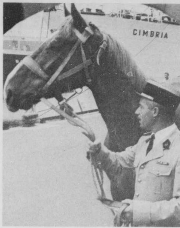
la Garde républicaine française. Auteur de plus de 100 films, Christian-Jaques réalise ce spectacle dans lequel 130 chevaux figureront.