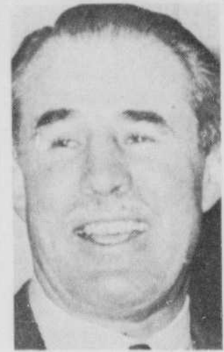
M. George Hees

TORONTO — Dans un énoncé de politique rendu public hier par son bureau de Toronto, M. George Hees préconise plus de souplesse dans les programmes de sécurité sociale. Il a critiqué le concept de l'universalité dans ce domaine.