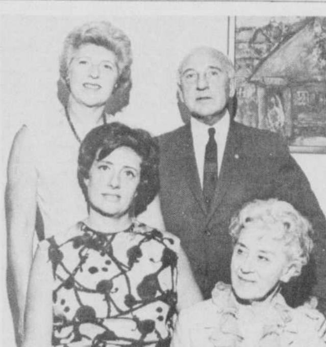
L'orchestre philharmonique d'Israël donnera un concert spécial mardi soir prochain, 22 août, à l'aréna Maurice Richard. Les profits de cette soirée seront versés au fonds d'urgence pour l'aide à l'Israël.