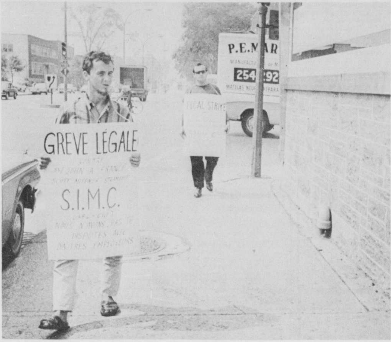
Les marins canadiens ont commencé à délaissier les navires hier à midi. On voit ici deux syndiqués

promenant leurs pancartes à l'une des entrées du port de Montréal.