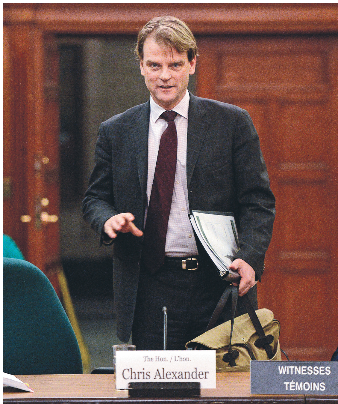
Le ministre fédéral de la Citoyenneté et de l'Immigration, Chris Alexander, a présenté mardi un projet de loi destiné à lutter contre ce que les conservateurs appellent des «pratiques culturelles barbares».

En vertu du projet de loi S-7, si une personne