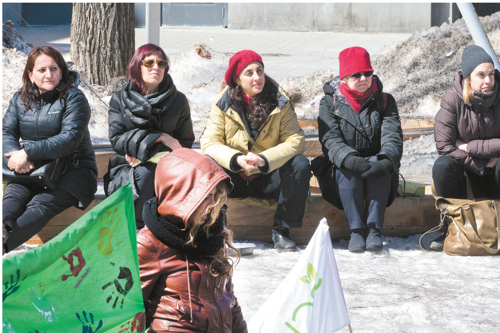
Des chargés de cours ont assisté sur l'heure du dîner mardi à une manifestation étudiante devant l'Université du Québec à Montréal.