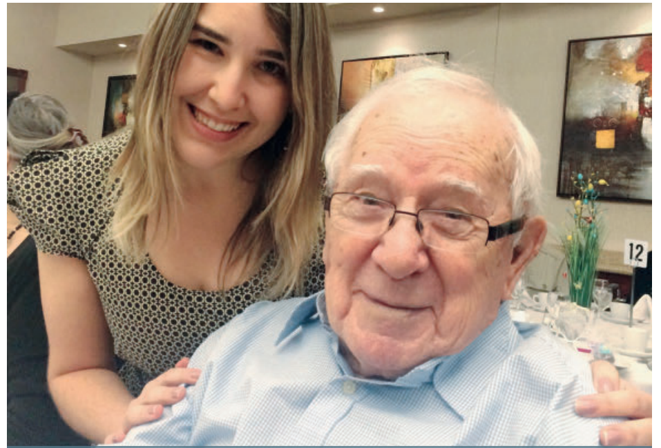
Dans les Basses-Laurentides, de Saint-Eustache à Saint-Jérôme, en passant par Sainte-Thérèse et Deux-Montagnes, on compte actuellement 38 vieux amis et une cinquantaine de bénévoles.

Le second prix est un kayak simple de la marque Bounty 100, incluant la pagaie, d'une valeur de 500 $. Quatre autres prix, d'une valeur de 100 $ chacun, seront aussi tirés au moment du tirage qui aura lieu le 29 novembre à 18 heures à l'hôtel Impéria de Saint-Eustache. Pour se procurer un billet, il suffit d'appeler au 450 598-1888 ou de visiter le [www.petitsfreres.ca/sainteustache/concours-2016].