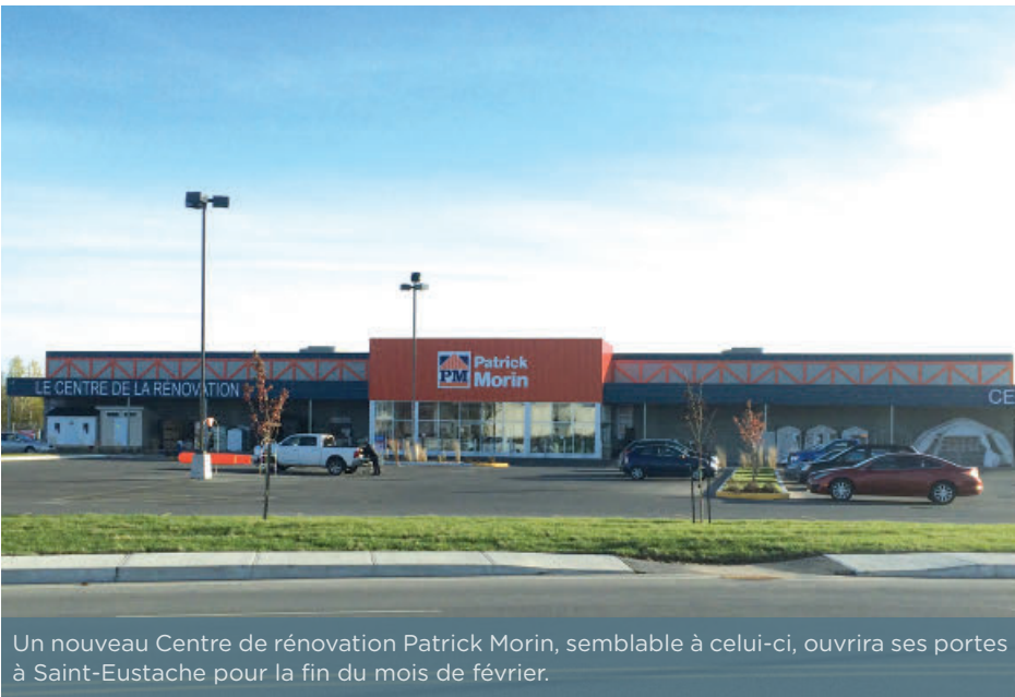
Un nouveau Centre de rénovation Patrick Morin, semblable à celui-ci, ouvrira ses portes à Saint-Eustache pour la fin du mois de février.