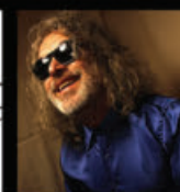
MICHEL PAGLIARO 12 NOVEMBRE 2016