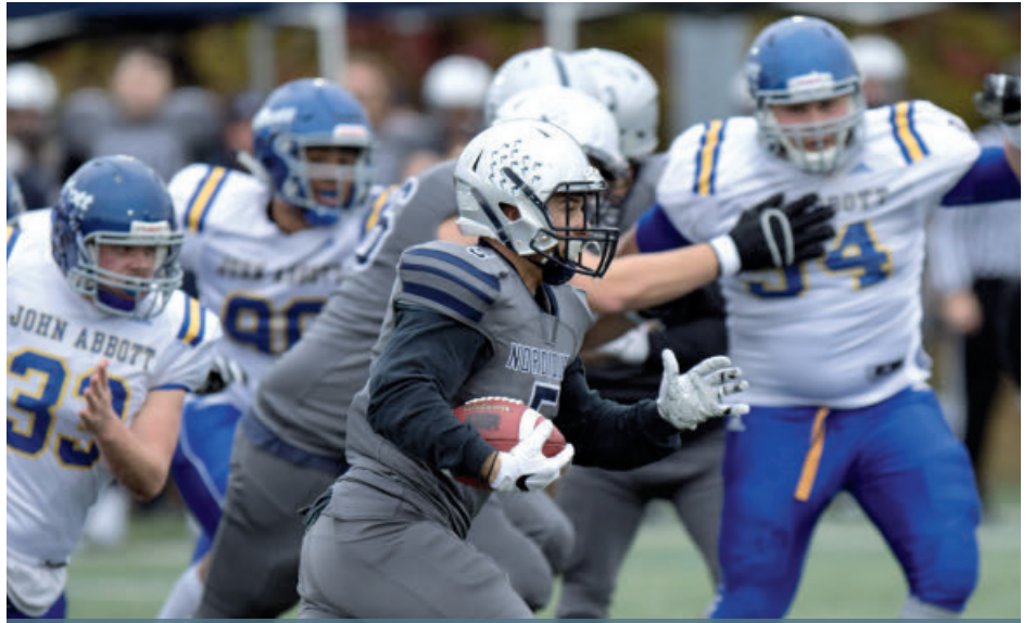
C'est par le score de 40-33 que les Nordiques ont battu le Collège John-Abbott, samedi, pour accéder à la finale du Bol d'or.

CHRISTIAN ASSELIN christian.asselin@groupejcl.ca