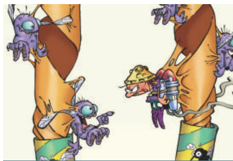
Game Over: Fatal Attraction (MAD Fabrik).