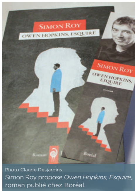
Simon Roy propose Owen Hopkins, Esquire , roman publié chez Boréal.