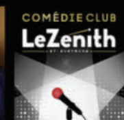
COMÉDIE CLUB LeZenith 14 NOVEMBRE 2016