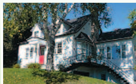
ACCÈS LAC DES 14 ILES – Très belle propriété. Rénovations majeures depuis 2010. Intérieur très chaleureux. Garage. MLS 11684128. 185 000 $