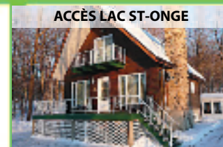
ACCÈS LAC ST-ONGE

Maison rénovée à aire ouverte à proximité du lac. 4 CAC, s./fam. Située dans une baie! MLS 19955673. 339 000 $