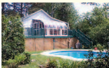
ACCÈS NOT. LAC DE L'ACHIGAN – Plain-pied. S.-sol fini. 1 foyer + 1 comb. lente. Solarium. Piscine creusée. Ter. clôturé. MLS 23070474. 177 000 $