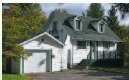
BORD LAC DES SOURCES – 80 pi bord de l'eau. 2 CAC, 2 s./bains, foyer, s.-sol, garage. Occupation immédiate. Veudu meublé. MLS 15599570. 195 000 $.