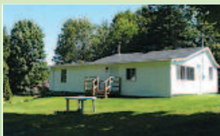
ACCÈS LAC BEAUDRY – Pl.-pied rénové. Aire ouv., 2 CAC, comb. lente. Ter. plat offrant intimité. Inst. sept. neuve. Accès à une plage du lac Beaudry à qqes pas. Bon rapport qualité/prix! MLS 16048547. 105 000 $