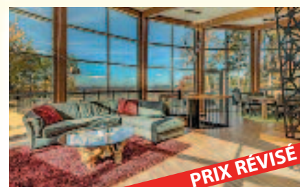
VUE! VUE! VUE! – Réserve Ogilvy. Sect. Montaubois. Superbe résidence à flanc de montagne. Architecture remarquable! Quiétude en pleine nature! MLS 25230717. 799 000 $