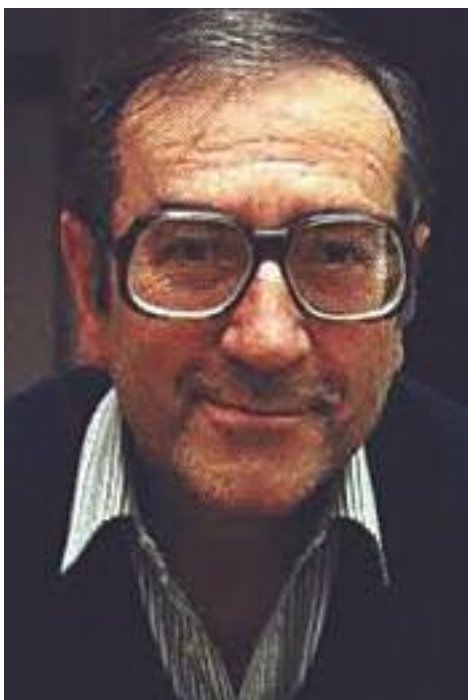
Gaston Miron. PHOTO COURTOISIE