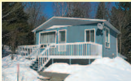
SECT. LAC ACHIGAN – Petite, coquette et prête à être habitée. 1 CAC. Sous-sol fini avec comb. lente et sortie ext. 2 remises. MLS 25288501. 99,500 $