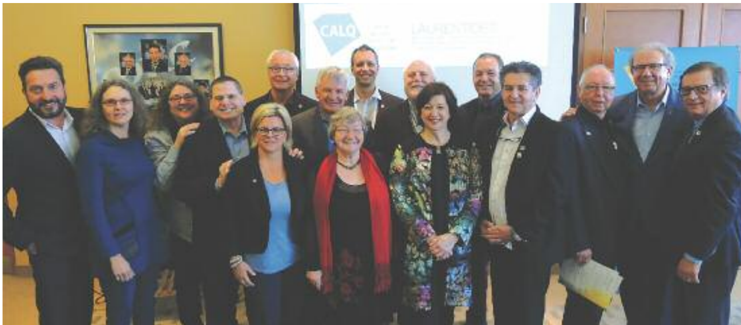
Les partenaires de l'entente posent fièrement.