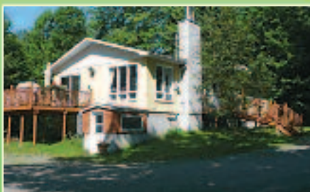
ACCÈS NOT. LAC CONNELLY – Plain-pied rénové. Sous-sol fini. 4 CAC. Foyer. Garage. Cabane à sucre fonctionnelle! Quai. MLS 11635074. 289 000 $