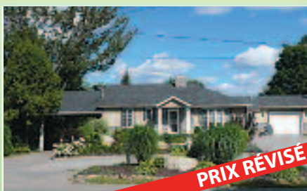
BORD LAC MAILLÉ – Plain-pied rénové et agrandi depuis 2007. 120 pi b./eau. Sous-sol fini, garage adj., remise. À 2 pas de tous les services. MLS 15254328. 310 000 $