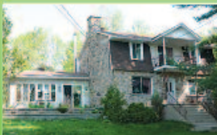
SECTEUR LAC CONNELLY – Belle propriété d'antan! Habillée de pierre autant à l'intérieur qu'à l'ext. 4 CAC. 2 foyers. Chaleureuse. Terrain : 36 360 p.c. MLS 26964160. 250 000 $

450 563-5559 www.immeublesdeshauteurs.com 2264, chemin des Hauteurs, Saint-Hippolyte