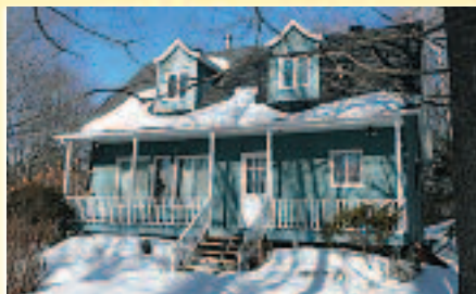
ACCÈS LAC MAILLÉ – Cottage (cui. 2 s./bains rénovées). 3 CAC + BUR. Comb. lente. S.-sol non-fini pl. grandeur avec sortie ext. À 10 min. de Saint-Jérôme. MLS 24826810. 199 900 $