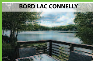
BORD LAC CONNELLY

450 563-5559 www.immeublesdeshauteurs.com 2264, chemin des Hauteurs, Saint-Hippolyte