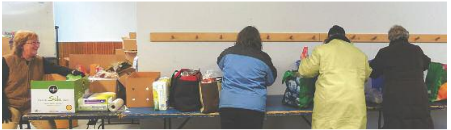
Les bénévoles préparent les boîtes qui seront généreusement données aux bénéficiaires du Comptoir grâce à vos dons en denrées alimentaires et en argent.