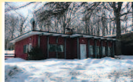
ACCÈS LAC CONNELLY – Plain-pied, 3 CAC, foyer au bois, vue sur l'eau. Ter.: 7961 p.c. Rue paisible. MLS 10465440. 119 000 $