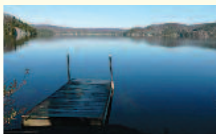
BORD LAC DE L'ACHIGAN – Vue!!! Site de 47447 p.c, 199 pi en bordure de l'eau. 4 CAC, 1 foyer, 1 comb. lente. Garage 27' X 21'. MLS 20541692. 599 000 $