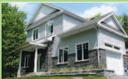
LIMITE SAINTE-SOPHIE/SAINT-HIPPOLYTE – Constr. 2013. Espaces bien conçus, aire ouverte sur la nature. 3 CAC + BUR. Ter.: 68 469 p.c., boisé. Garage (1). À 12 min. de Saint-Jérôme. MLS 21111616. 319 000 $