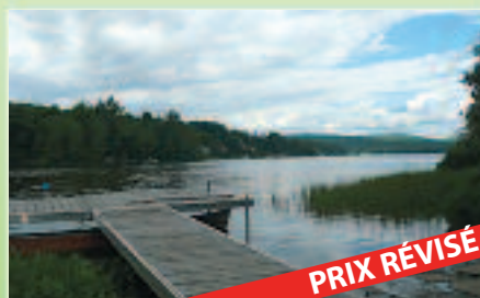
BORD LAC CONNELLY – Pl.-pied (1997), 3 CAC, 2 SDB, 2 foyers. Ter. plat (20 679 p.c.). S.-sol (rez-de-jardin/intergénération). MLS 15562865. 375 000 $