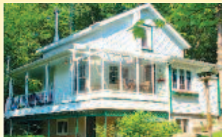
BORD LAC MORENCY – Dans le village de Saint-Hippolyte. Vue panoramique! 3 CAC, bur., 2 poêles (bois et granules). Solarium. À pied des princ. services. MLS 23983581. 284 000 $