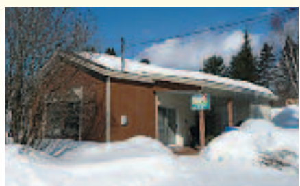
ACCÈS LAC MORENCY – Domaine Cabanac, pl.-pied 2 CAC, poêle au bois. À 2 pas du lac avec vue sur l'eau. Accès tennis, piscine, plage, quai. MLS 14059213. 159 000 $