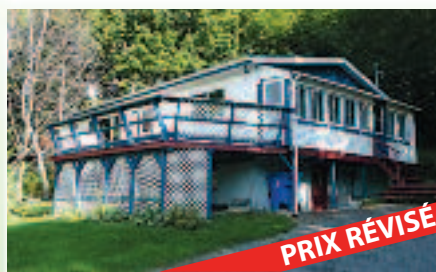
SAINT-HIPPOLYTE – Plain-pied. 3 ch. à coucher. Comb. Lente. Sous-sol pl. grandeur, non-fini. À 12 min. de Saint-Jérôme. MLS 25964463. 129 500 $