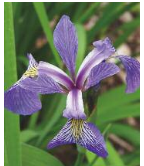
Iris versicolore.