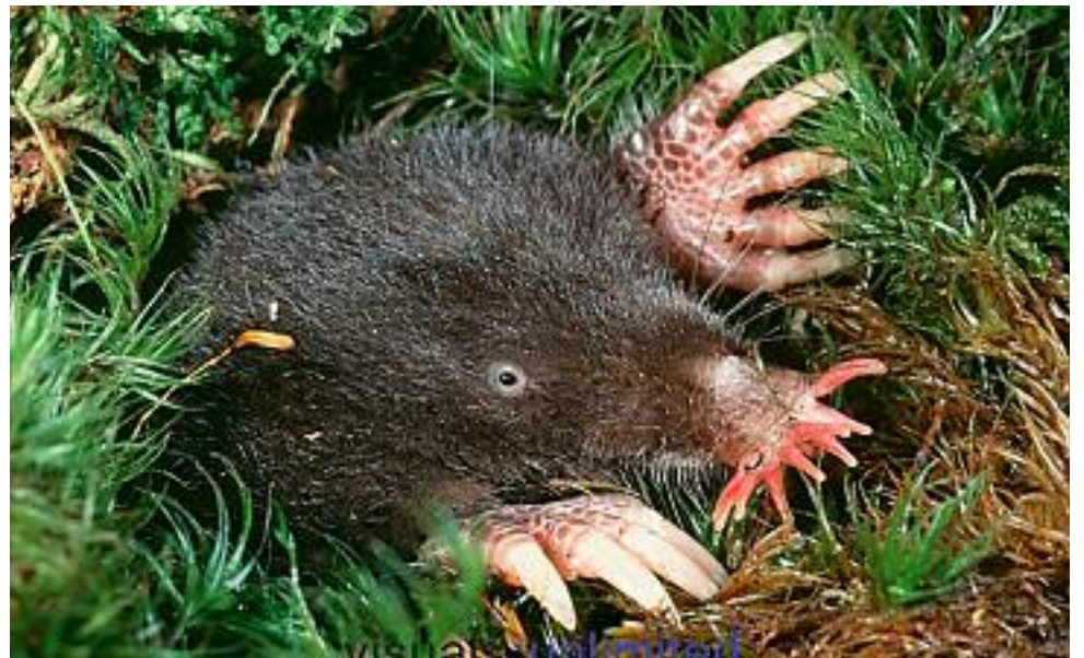
Condylure à nez étoilé.