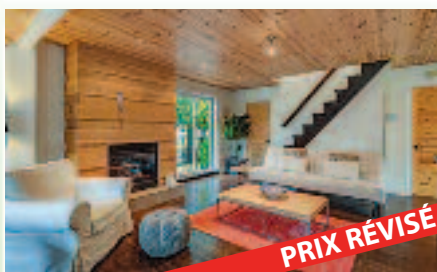
SECTEUR LAC CONNELLY – Maison rénovée! 3 CAC. Foyer propane. Garage 22' X 30' porte électr./syst. d'alarme. Occupation rapide! MLS 13929707. 199 900 $