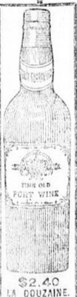
$2.40 LA DOUZAINÉ.