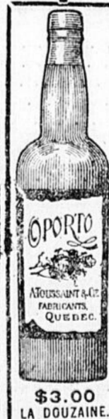
$3.00 LA DOUZAINÉ.