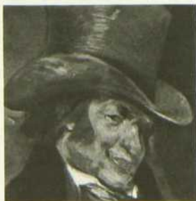
«Goya, le cœur de l'Espagne». Documentaire réalisé par Jean Creach. Réflexions sur l'œuvre de Goya et sur la Cour d'Espagne.