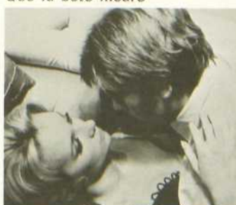
Que la bête meure

L'intrigue de Que la bête meure débute avec la mort d'un petit garçon, assassiné en somme puisque l'enfant a été la victime d'un chauffard. Inconsolable Marc, père de l'enfant, jure de venger la mort de son fils. Il n'a plus qu'un but dans la vie: retrouver le meurtrier et le supprimer. Après une enquête longue et difficile, le hasard lance Marc sur une bonne piste. Il apprend que la passagère de l'auto était une jeune actrice de la télévision nommée Hélène. Marc s'arrange pour la rencontrer, lui faire la cour et la séduire. Hélène présente Marc à sa famille, entre autres à Paul, son beau-frère. Celui-ci était le chauffeur de l'auto qui ne s'est pas arrêtée après avoir renversé le fils de Marc. Etre égoïste et grossier, détesté de sa famille, notamment de son fils Philippe, Paul sera une proie d'autant plus facile à abattre pour Marc, qui n'aura aucun scrupule à supprimer un personnage aussi odieux. Une première tentative de meurtre échoue parce que Paul est au courant du dessein de Marc. Mais celui-ci sera servi par les événements.