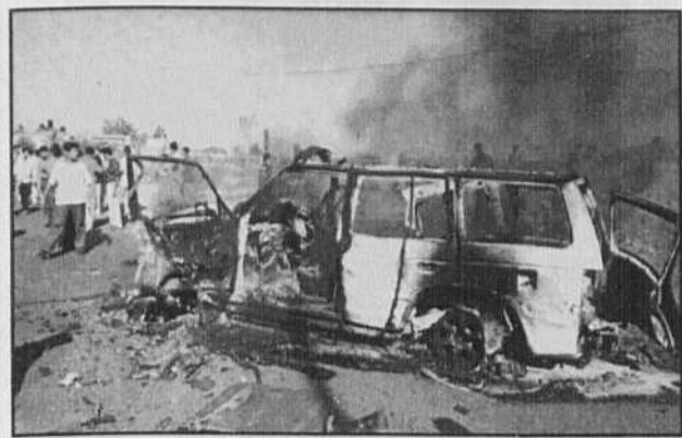
La tension a encore monté d'un cran en Cisjordanie hier. Le bilan des morts atteint maintenant 51 et on dénombre un millier de blessés.