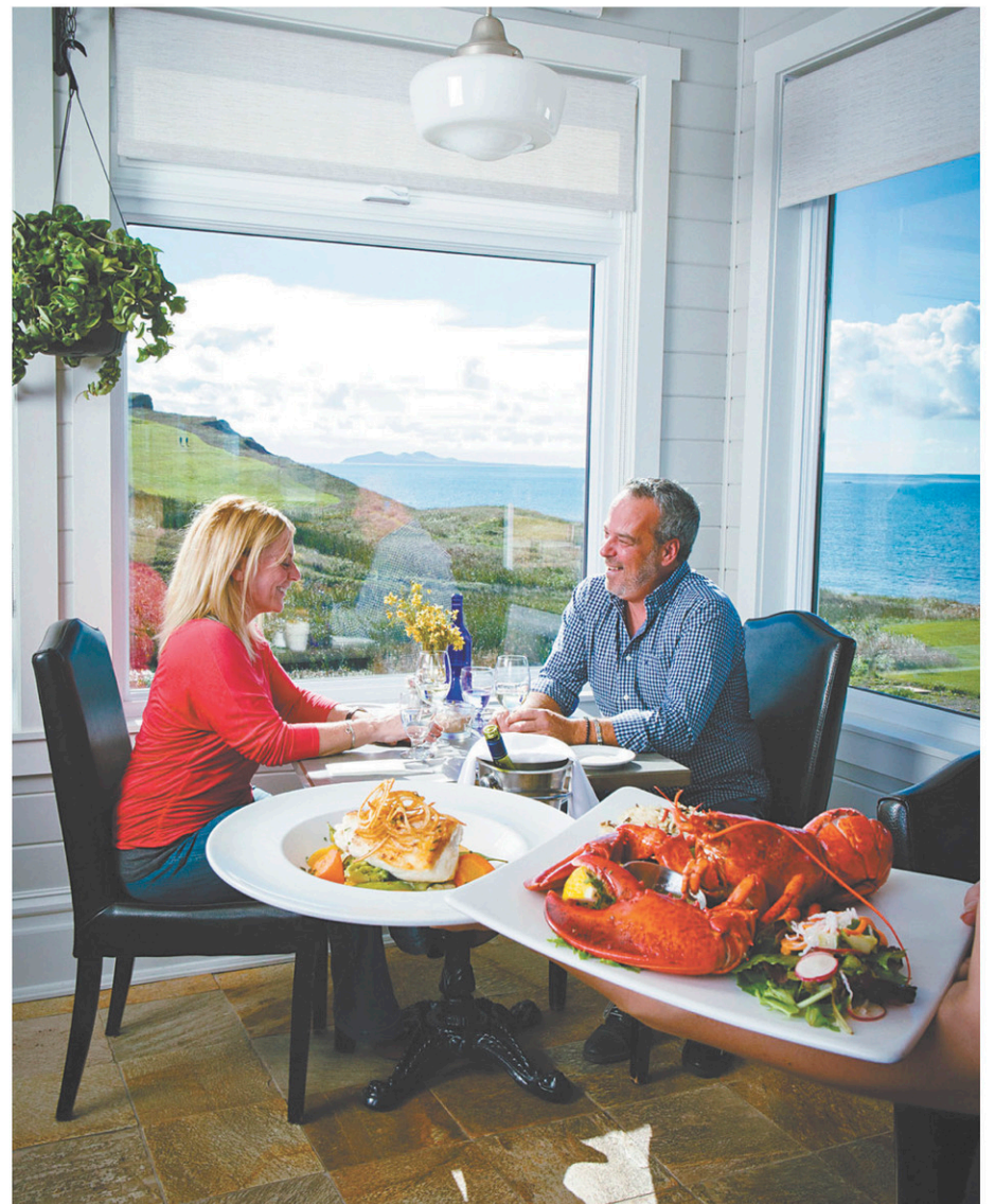
Les Croisières CTMA proposent des croisières vers les îles de la Madeleine de juin à septembre. Les différents forfaits tout inclus permettent dorénavant de découvrir les îles selon les intérêts de chacun: forfait Saveurs (ci-dessus), Art et culture ou Vélo.

Les voies d'eau sont des voies royales pour parcourir le Québec du nord au sud et d'est en ouest. La découverte de ces points de vue inédits donne aux paysages familiers des allures exotiques. La croisière; un dépaysement garanti!