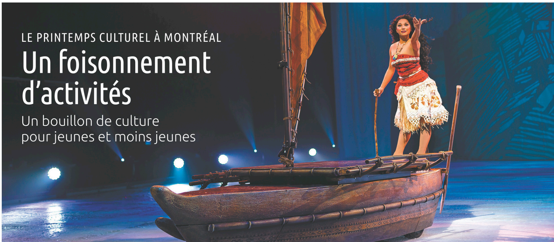
DISNEY SUR GLACE

Un bouillon de culture pour jeunes et moins jeunes