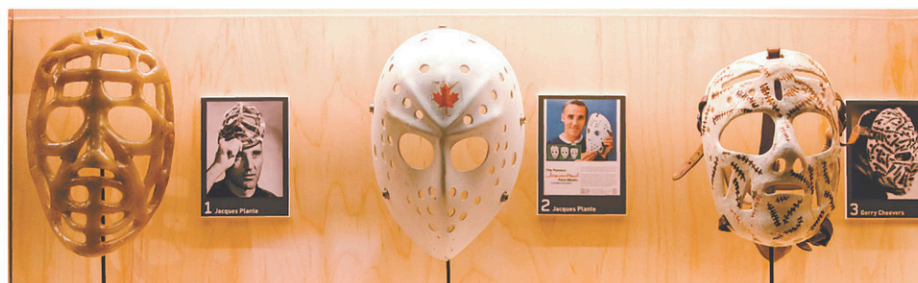
Premiers masques du gardien de but Jacques Plante

L'exposition mettra en valeur plus de 350 objets, dont des statues monumentales, des fresques, des sarcophages, une momie, des objets funéraires et des bijoux associés aux reines mythiques telles que Néfertari, Néfertiti et Hatchepsout.