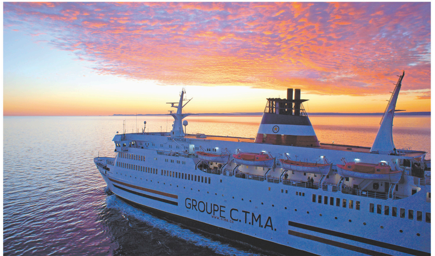
Lever de soleil à Tadoussac

Le Passe-Fjord permet de naviguer à volonté; ainsi les adeptes de cyclo-tourisme pourront planifier leur itinéraire et traverser d'une rive à l'autre pour emprunter la Véloroute du Saguenay.