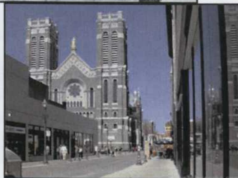
2. Rue Saint-Joseph de nos jours.