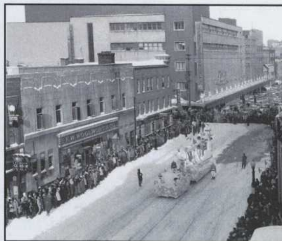
1. Le char du Bonhomme, boulevard Charest, au défilé de la Basse-Ville en 1957.

Aujourd'hui, la vie sociale du quartier est stimulée par les divers événements culturels. Il est redevenu un centre-ville et la nouvelle destination courue au cœur de Québec. Une réhabilitation de l'espace s'opère, un nouveau tissu social se forme à l'image de plusieurs autres centres villes en Amérique. Saint-Roch retrouve un attrait, un dynamisme longtemps souhaité par plusieurs. Mais ce renouveau tant espéré tient-il compte de la vie de tous ceux qui y habitent? Les travaux visant à retirer complètement le toit du mail sont en cours ce printemps. Cette dernière phase affirmera la mutation de ce quartier. Sonnera-t-elle aussi le glas de l'occupation du quartier et de la rue Saint-Joseph par le segment le plus pauvre de sa population?