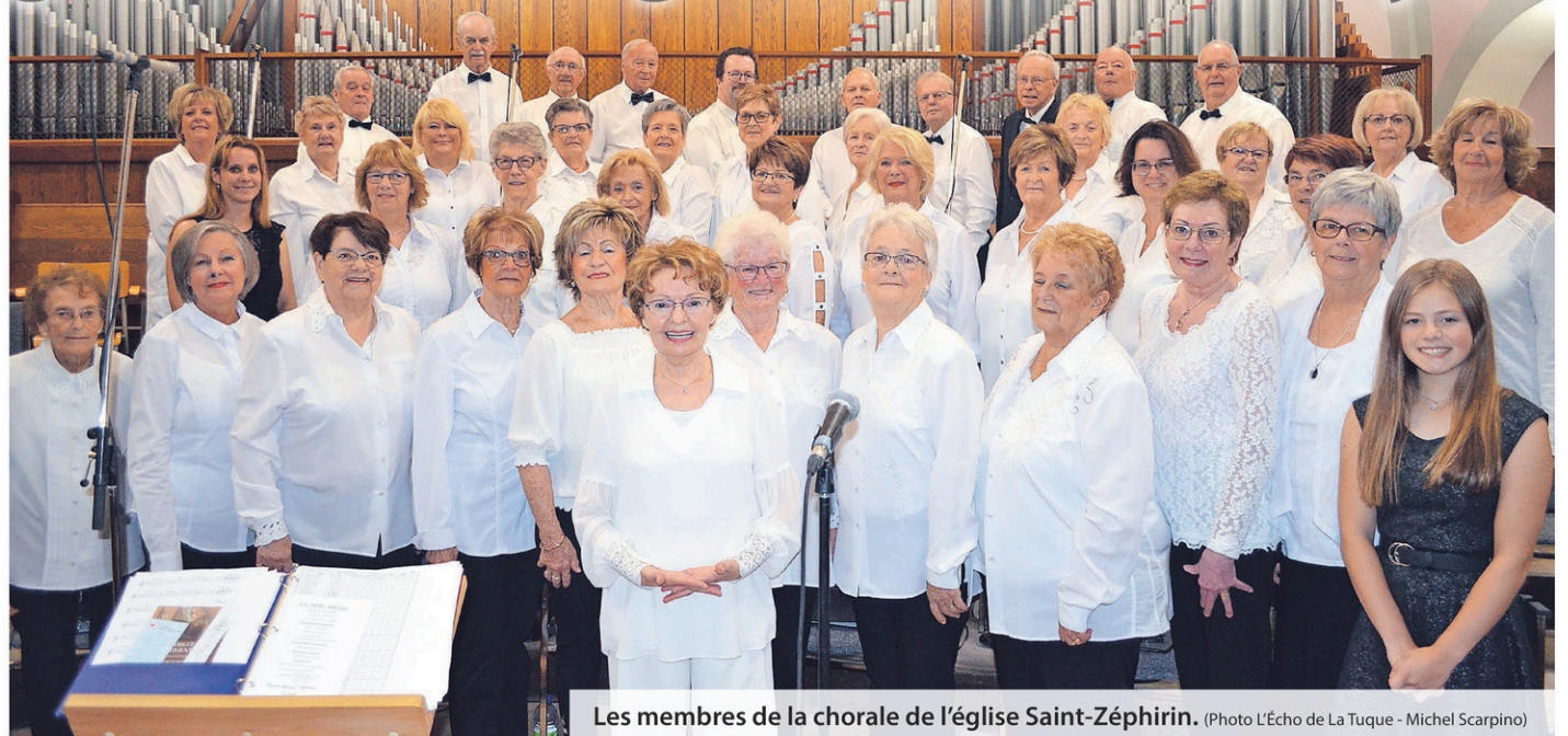
Les membres de la chorale de l'église Saint-Zéphirin.

L'orgue avait été acquis dans les années 60, au coût de 59 000 $. Les responsables estiment que si on avait à en faire l'acquisition en dollars d'aujourd'hui, la facture pourrait s'élever à 1,5 M$.