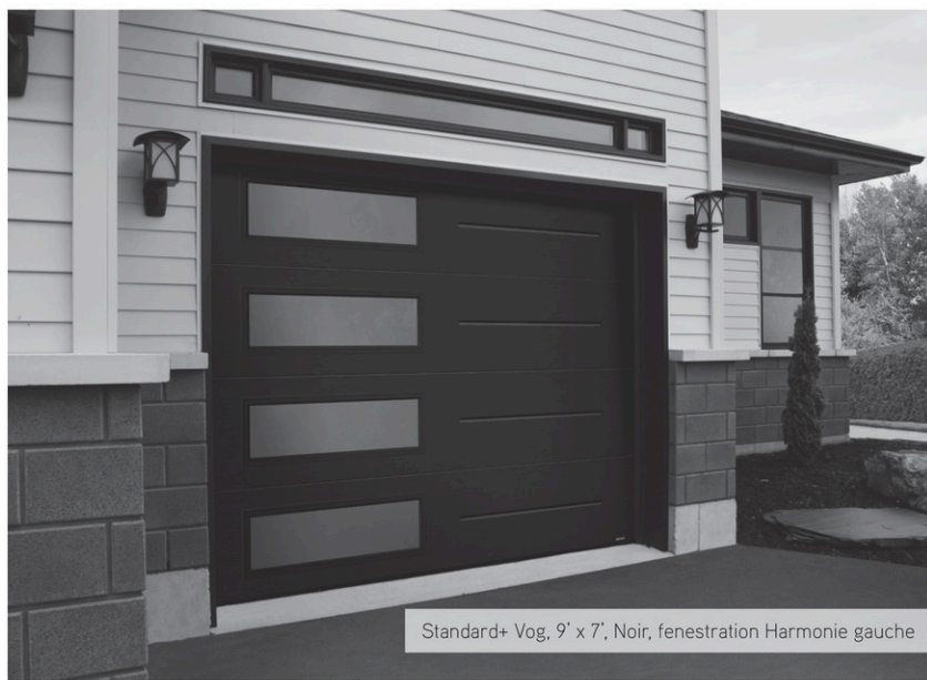
Standard+ Vog. 9' x 7', Noir, fenestration Harmonie gauche

Pour votre porte de garage, faites affaires avec les vrais experts !