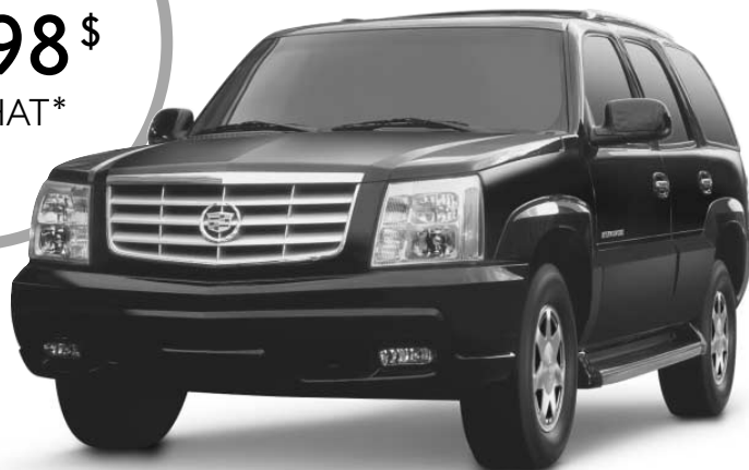
Escalade 2002 de Cadillac

Le véhicule utilitaire sport le plus puissant au monde.*