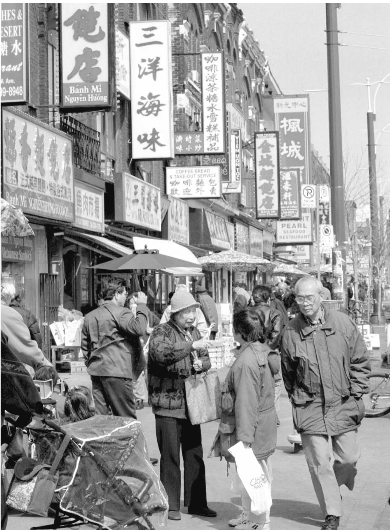
Le quartier chinois de Toronto. La Ville reine se targue d'accueillir la plus grande communauté chinoise d'Amérique du Nord avec plus de 450 000 membres.