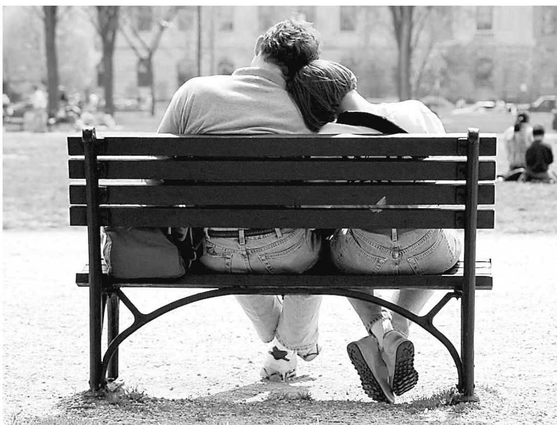
Il faut savoir qu'on ne peut pas rentrer dans une histoire d'amour si on n'abandonne pas le vieux soi. Même si cela fait très peur.