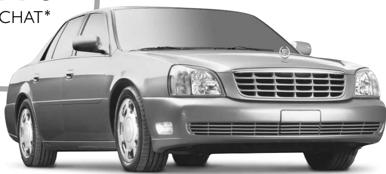
DeVille 2002 de Cadillac