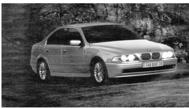
La BMW 530d dont les mérites sont vantés dans le dernier numéro de Science et Vie .