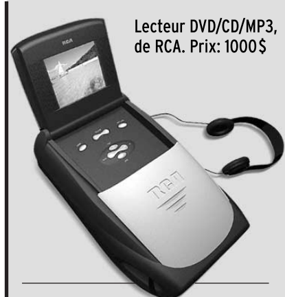
Lecteur DVD/CD/MP3, de RCA. Prix: 1000 $

Ces gadgets coûteux valent-ils la peine ? « Oui, répond sans hésitation un père (fortuné) de trois enfants du primaire. À tout le moins pour faire cesser les chamailleries de la banquette arrière ! » On n'en doute pas.