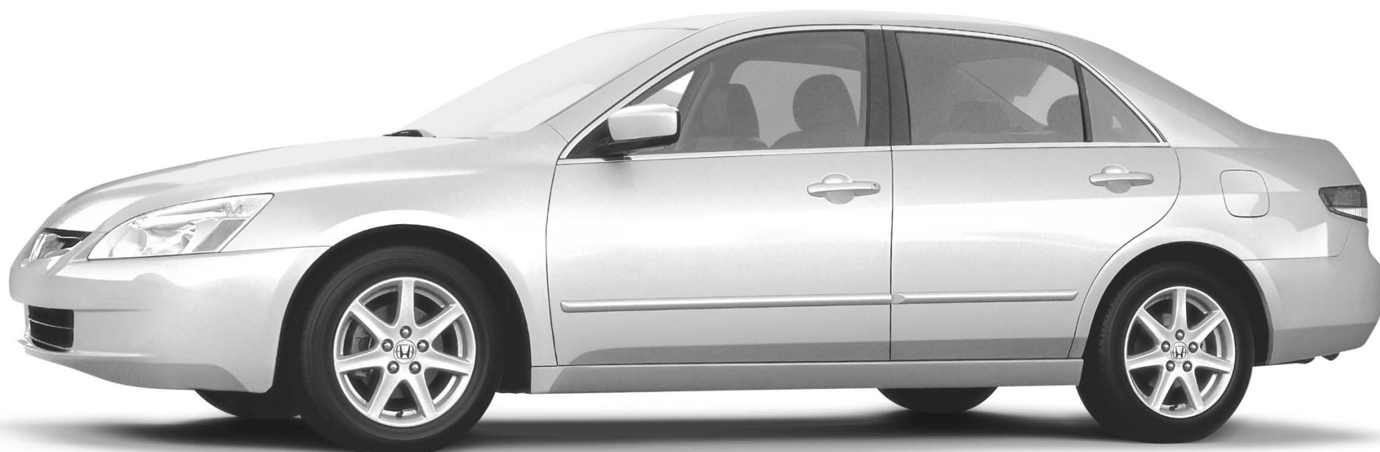
Berline Accord EX V6 2003 Illustrée

Éric Lefrançois, La Presse , 26 août 2002