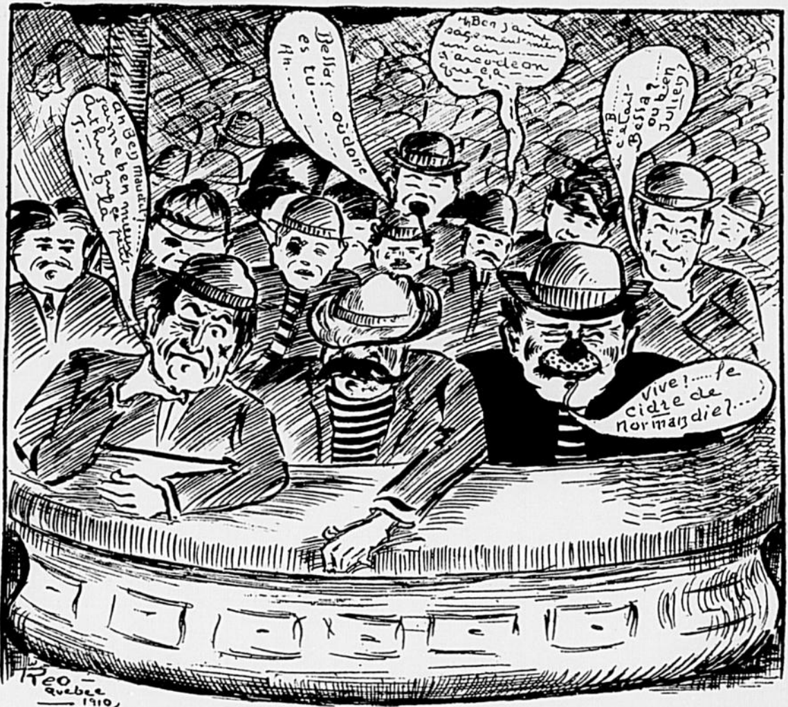
En dépit de la réputation de sens artistique de nos amis de la vieille Capitale, la Compagnie d'Opéra Français n'a pas reçu un bien fervent accueil.

Les décors de M. S. D. Parker sont merveilleux.